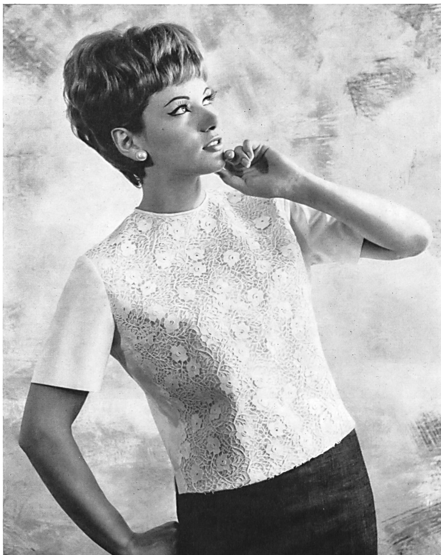
FORSTER WILLI & CO., SAINT-GALL Guipure Modèle K. E. Spranger, Konstanz Foto-Atelier Ihle-Werbung