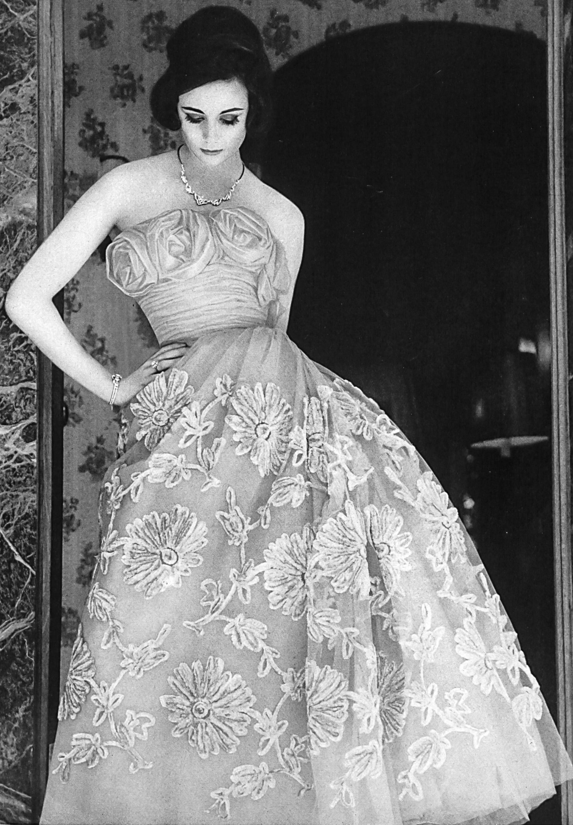
FORSTER WILLI & CO., SAINT-GALL Tulle de ton abricot avec broderie chenille Aprikosefarbene Tüll mit Chenillestickerei Modèle Toni Schiesser, Frankfurt a. M.