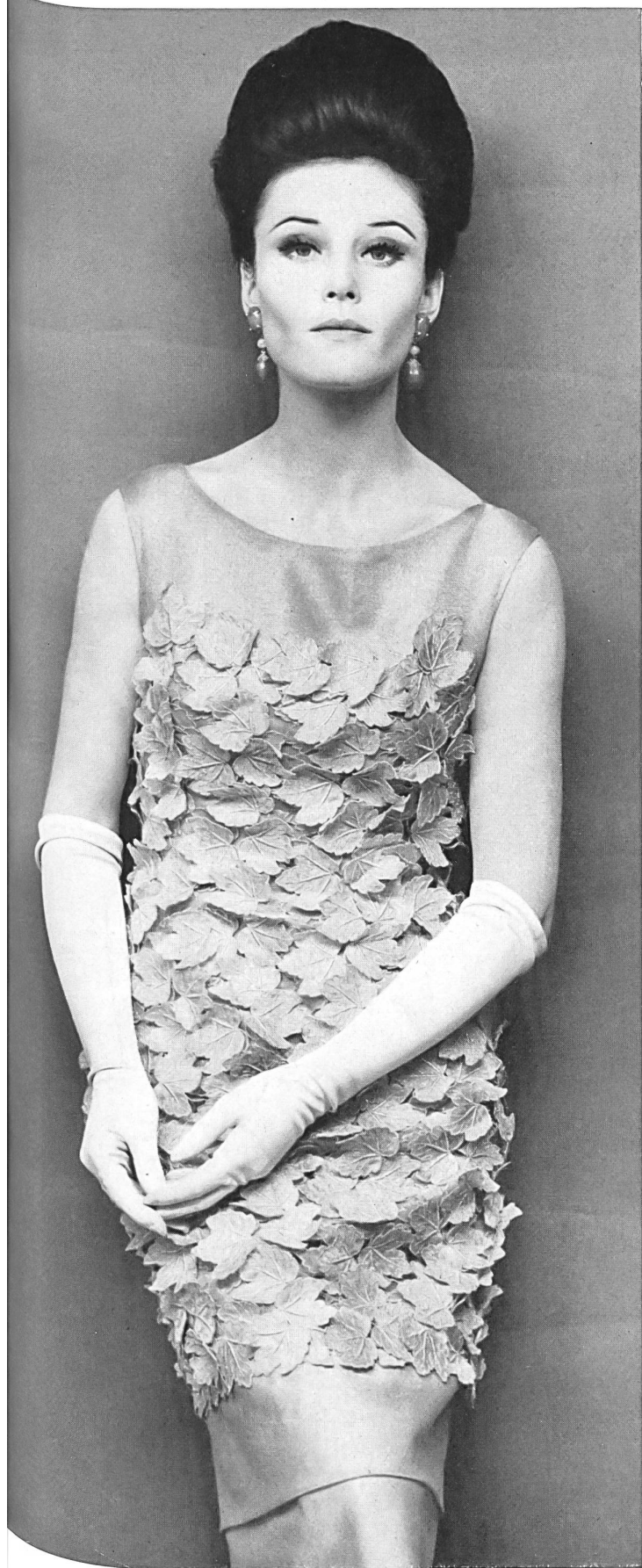
FORSTER WILLI & CO., SAINT-GALL Feuilles de vigne or en broderie chimique Rebblätter aus goldener Aetzspitze Modèle Staeb-Seger, Berlin