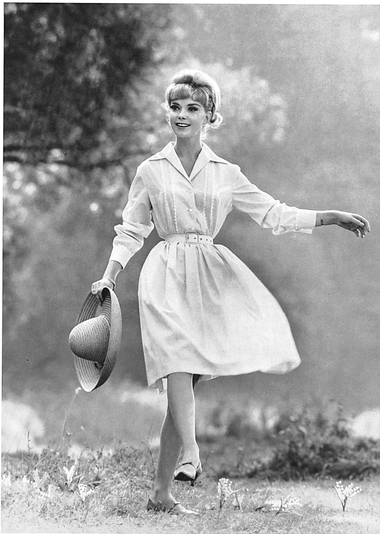
METTLER & CO., S.A. SAINT-GALL Tissu de coton « Minicare » « Minicare » Baumwolle Joseph Bancroft & Sons Co. A.G., Zurich Modèle Bessie Becker, München