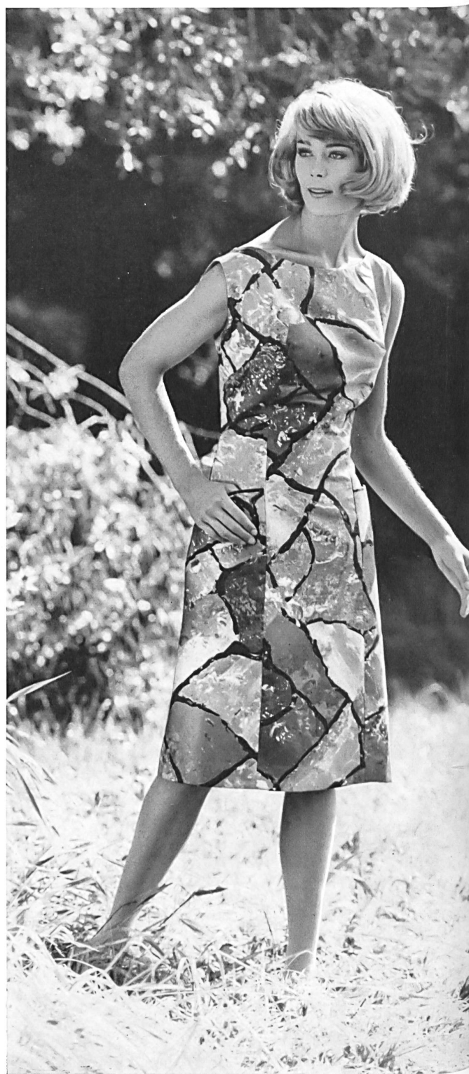
METTLER & CO. S.A., SAINT-GALL Tissu de coton « Minicare » « Minicare » Baumwolle Joseph Bancroft & Sons Co. A.G., Zurich Modèle Carola Murek, Hamburg