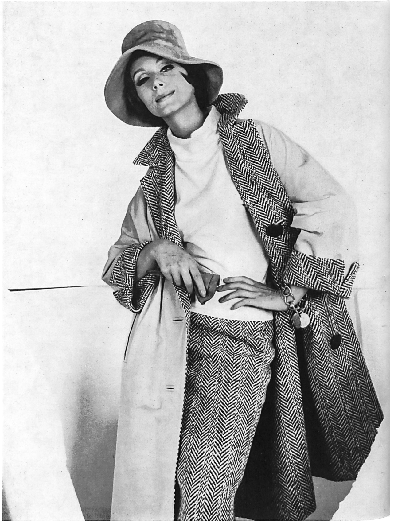
STOFFEL S. A., SAINT-GALL Tissu de coton « Aquaperl » « Aquaperl » Baumwollgewebe Modèle Trenchcoat Baumann, München