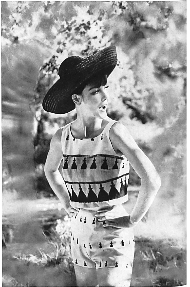
REICHENBACH & CO., SAINT-GALL Cambric « Minicare » brodé Bestickter « Minicare » Cambric Joseph Bancroft & Sons Co. A.G., Zurich Modèle Jugendmoden Mickhausen