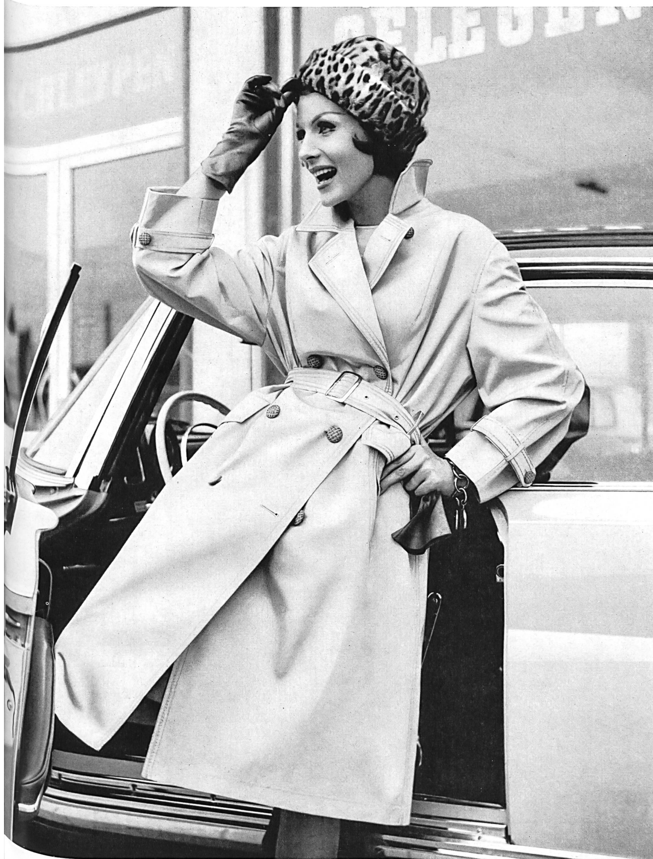
STOFFEL S. A., SAINT-GALL Tissu de coton « Aquaperl » « Aquaperl » Baumwollgewebe Modèle Trenchcoat Baumann, München