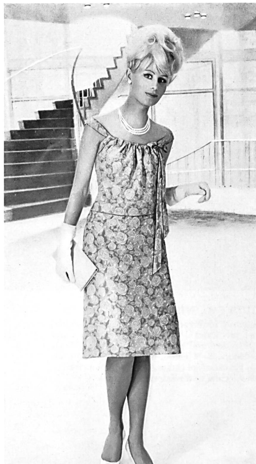
STOFFEL S.A., SAINT-GALL Batiste pur «Térylène» Robes épinglées par Werner Hoehn