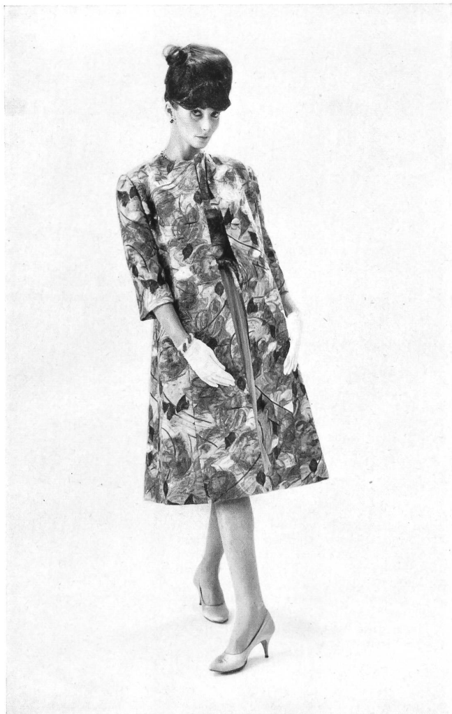
METTLER & CIE S.A., SAINT-GALL Brocart de coton Cotton brocade Modèle Philip Hulitar, New York Bijoux de / Jewellery by Cartier, New York