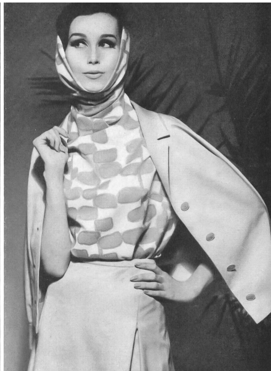
ROBT. SCHWARZENBACH & CO., THALWIL Panama Fresco imprimé, 67 % Diolène, 33 % coton. Fresco Panama bedruckt, aus 67 % Diolen und 33 % Baumwolle. Modèles Lauer-Böhlendorff, Krefeld.

A l'occasion de l'Interstoff, foire spécialisée pour les textiles d'habillement, qui a eu lieu à Francfort du 19 au 22 juin 1962, nous avons eu l'occasion d'assister à une présentation de mode consacrée aux imprimés sur « Diolène », une fibre synthétique fabriquée par les Vereinigte Glanzstoff-Fabriken A.-G. à Wuppertal; cette manifestation avait lieu dans le restaurant belvédère de la tour Henninger. A part la presse professionnelle, y assistaient aussi les fabricants de tissus et imprimeurs sur tissus intéressés, les confectionneurs qui présentaient leurs modèles ainsi que des représentants de l'industrie de la confection et du commerce de détail.