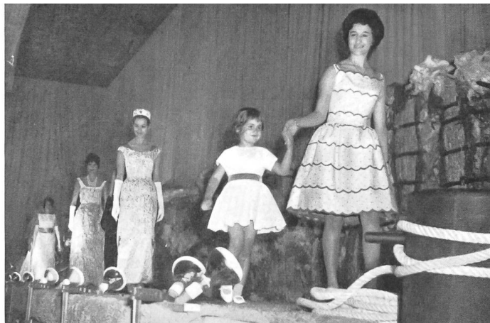
Le défilé, parmi les balles de coton brut, dans les entrepôts de la Compagnie suisse de Navigation S. A., à Bâle.

The fashion parade among the bales of raw cotton in the Swiss Shipping Company's depots in Basle.