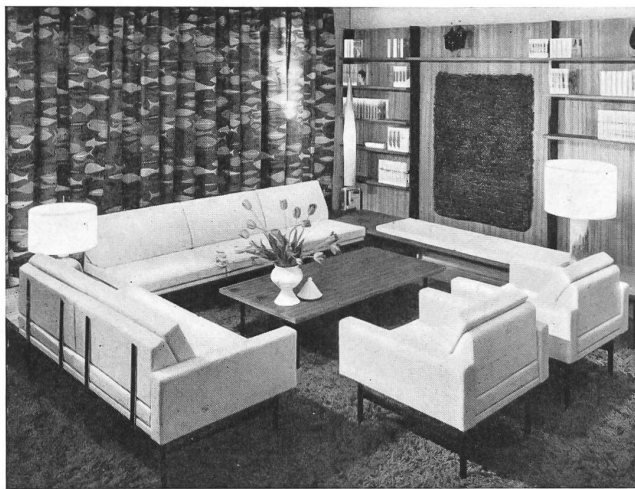
Un beau rideau en tissu de coton imprimé suisse, exposé chez Idealheim S. A., Bâle. An attractive curtain in a Swiss cotton print, on display at Idealheim Ltd., Basle. Una hermosa cortina suiza de género de algodón estampado expuesta en la tienda de Idealheim S. A., Basilea. Ein schöner Vorhang aus bedruckter Baumwolle ausgestellt in der Idealheim A.-G., Basel.

On sait que, indépendamment de la vogue toujours renouvelée de la broderie suisse, les efforts continuels des producteurs pour faire du coton un tissu noble, à la fois agréable à l'usage et élégant au porter, ont développé considérablement l'importance économique de cette branche. En 1961, l'exportation suisse de produits de coton s'est élevée à 379 millions de francs suisses ($ USA = 88,6 millions) dont un peu plus d'un tiers pour la broderie. Pendant la même année, la Suisse a exporté plus de 4800 tonnes de filés et filés retors de coton, en quantités égales pour l'une et l'autre sorte et 7474 tonnes de broderies et tissus de coton. La filature du coton occupe en Suisse 1,3 million de broches et la retorderie 350.000, alors qu'il y a 20.000 métiers à tisser en action dans les quelque 100 entreprises de tissage; les produits de l'industrie du coton sont finis dans 50 établissements de perfectionnement et 180 maisons de commerce s'occupent