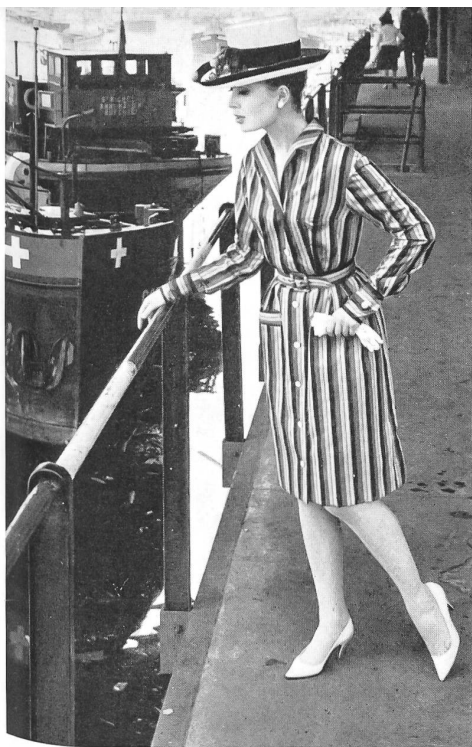
Coton tissé en couleurs. Colour-woven cotton fabric. Algodón tejido en colores. Buntgewebte Baumwolle. Modèle Kurt A.-G., Lucerne.