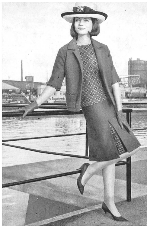
Coton tissé en couleurs et uni. Colour-woven and plain cotton fabric. Algodón tejido en colores y liso. Buntgewebte und uni Baumwolle. Modèle Hugo Brandeis A.-G., Zurich.