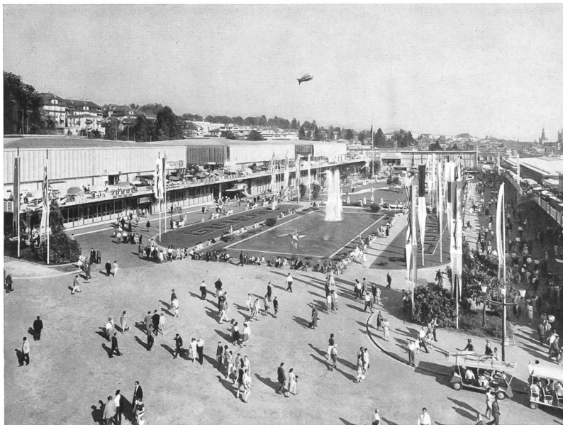
Les jardins et les halles latérales de la Foire de Lausanne, vus de la halle centrale.

La 43 e Foire de Lausanne a lieu, cette année, du 8 au 23 septembre. Près de 2400 exposants suisses y participeront, réalisant une fois de plus une large synthèse de l'activité nationale, tout en mettant l'accent sur le machinisme agricole, l'industrie du lait et de ses dérivés, sur