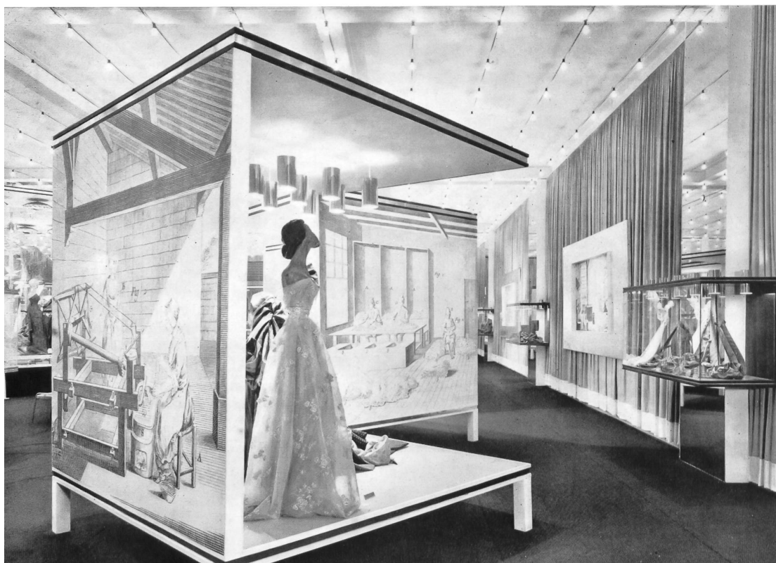
Coup d'œil dans le salon « Création ».

Eine Taschentuch-Dekoration im Stand von Stoffel A.-G., St. Gallen.