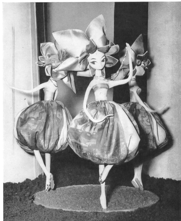
Un aspect du stand des mouchoirs de Stoffel S. A. à Saint-Gall.

Le salon « Création » est la plus ancienne exposition collective des textiles à la Foire Suisse. Il s'agit d'une manifestation de prestige, à laquelle participent, par le truchement de leurs organisations professionnelles, les industries du coton, de la laine, de la soie et de la rayonne et fibres synthétiques ainsi que les broderies de Saint-Gall,