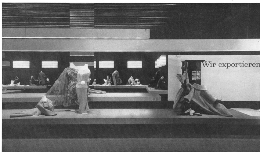
Articles d'exportation de l'industrie suisse de l'habillement. Swiss garments for foreign countries. Vestidos suizos para la exportación. « Wir exportieren » sagen die schweizerischen Bekleidungsfabrikanten.

des acheteurs étrangers, ce qui permettait aux visiteurs de se faire une idée de l'importance que ce secteur de l'industrie suisse occupe dans les exportations. La sobriété architecturale du salon, dont on pouvait embrasser l'ensemble d'un seul coup d'œil, concentrait l'attention sur les articles exposés, disposés sur des plates-formes blanches, vert émeraude et rouges entre des parois cyclamen. L'ensemble, un peu austère, donnait l'impression d'une grande recherche.