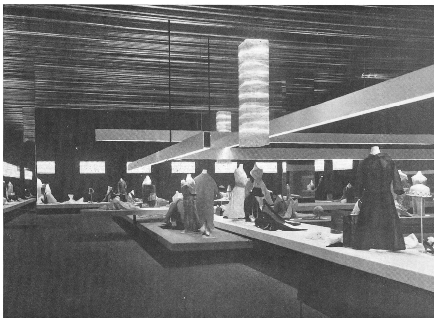
Création Vue partielle - Partial view - Vista parcial - Teilansicht.

avec le concours de la fabrique de chaussures Bally. Cette année, comme de coutume, c'est l'artiste bâlois Donald Brun qui était responsable de la conception artistique d'ensemble, alors que le décorateur Theo Wagner était chargé de la présentation proprement dite des tissus. On ne résume pas une exposition telle que celle-ci, les photos ci-contre en fixent quelques aspects; on notera l'élégance du détail et la clarté de l'ensemble.