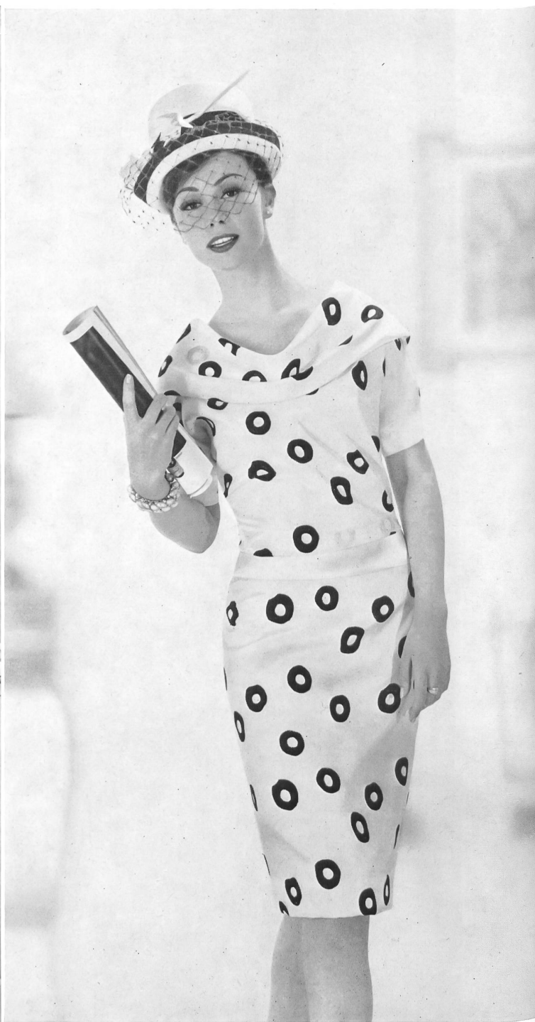
BÉGÉ S. A., TISSUS NOUVEAUTÉS, ZURICH « bégé » Coïmbra, pure soie — pure silk — seda pura — reine Seide.