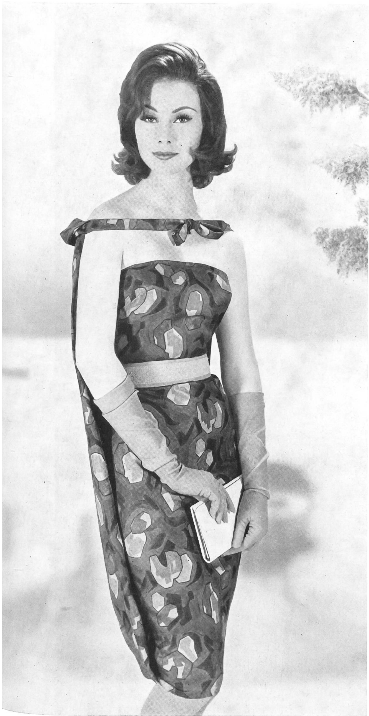
BÉGÉ S. A., TISSUS NOUVEAUTÉS, ZURICH « bégé » Atlantic, coton Sea Island — Sea Island cotton — algodón de Sea Island — Sea Island Baum- wolle.