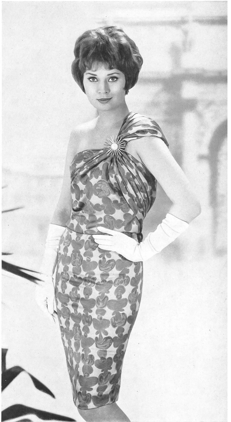
BÉGÉ S. A., TISSUS NOUVEAUTÉS, ZURICH « bégé » Coïmbra, pure soie — pure silk — seda pura — reine Seide.