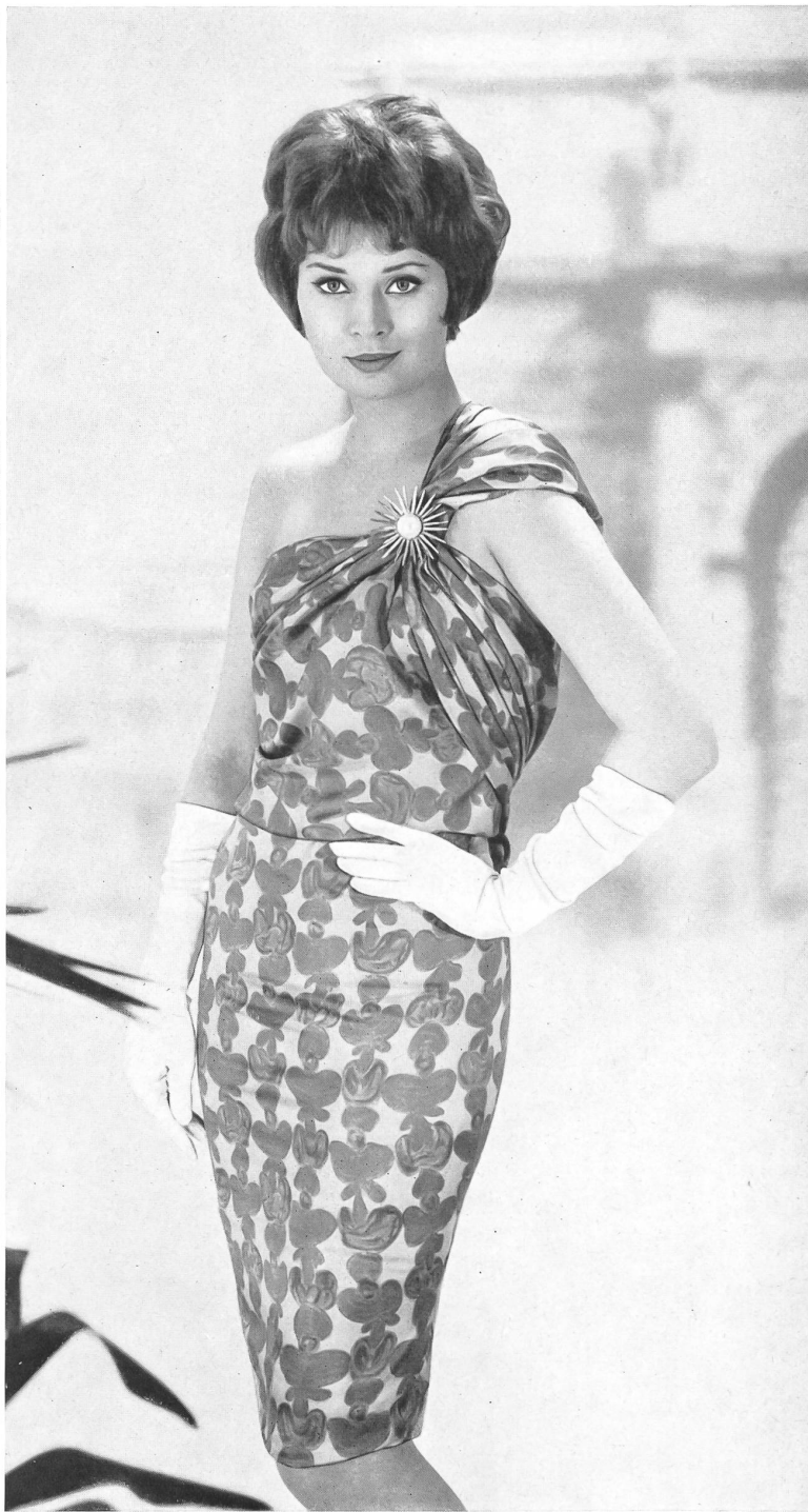
BÉGÉ S. A., TISSUS NOUVEAUTÉS, ZURICH « bégé » Coïmbra, pure soie — pure silk — seda pura — reine Seide.