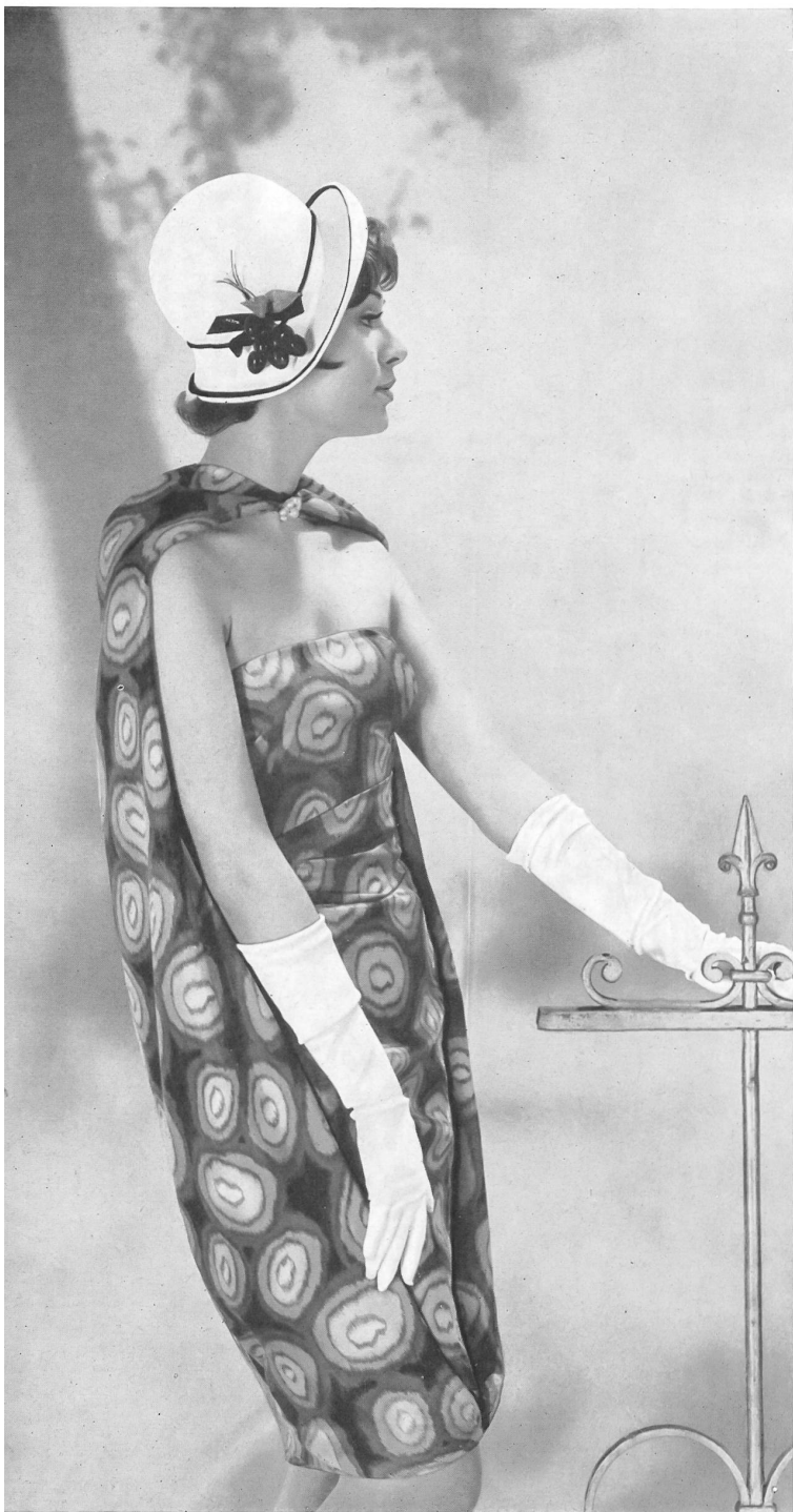
BÉGÉ S. A., TISSUS NOUVEAUTÉS, ZURICH « bégé » Coïmbra, pure soie — pure silk — seda pura — reine Seide.