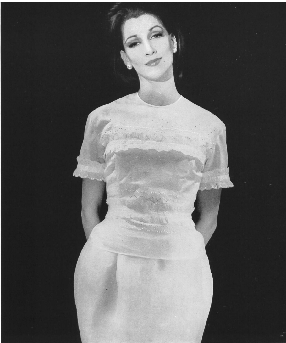
CARVEN « Nelo », broderie coton « Belrosa » Minicare de J. G. Nef & Co. S. A., Hérisau