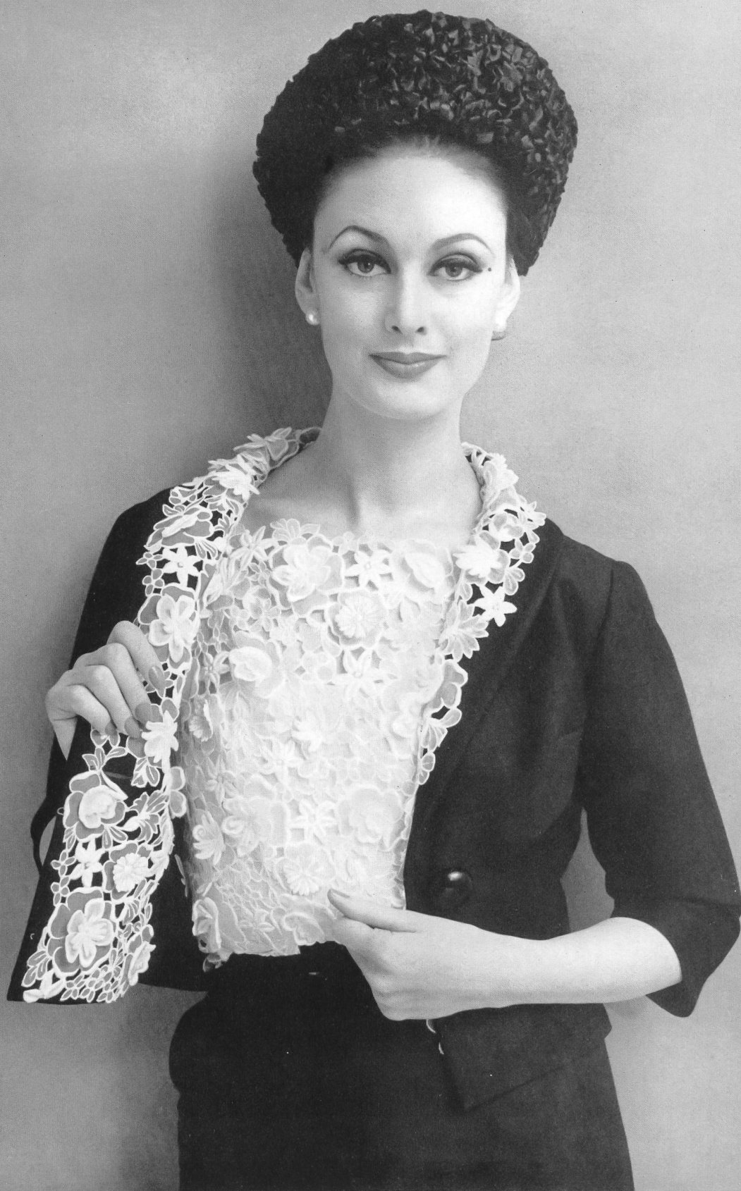
JEAN DESSÈS Galon d'organdi découpé de Forster Willi & Co., Saint-Gall Grossiste à Paris: Pierre Brivet, S.à r.l.