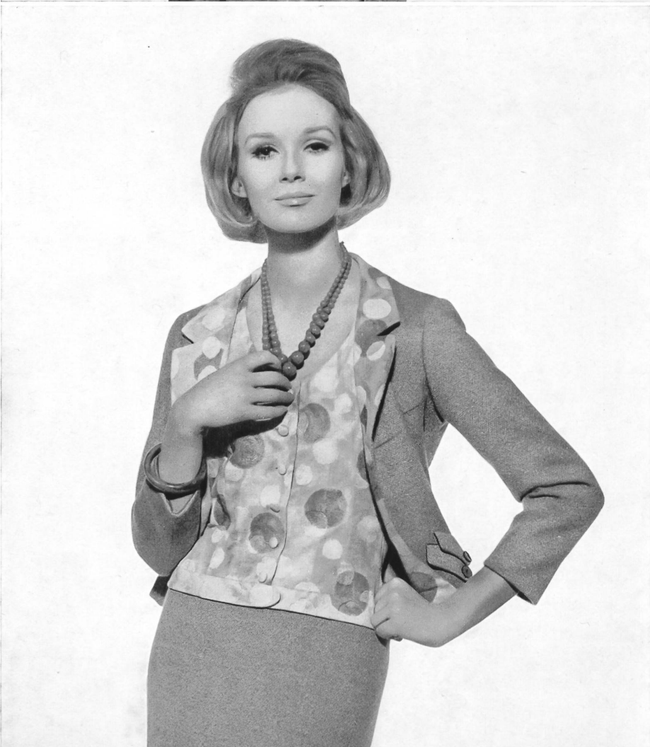
RECTIFICATION La légende de chacun de ces deux documents, parus aux pages 82 et 189 de « Textiles Suisses » N° 2/1962, ne men- tionnait pas le nom du gros- siste exclusif à Paris : la Maison Lahondès