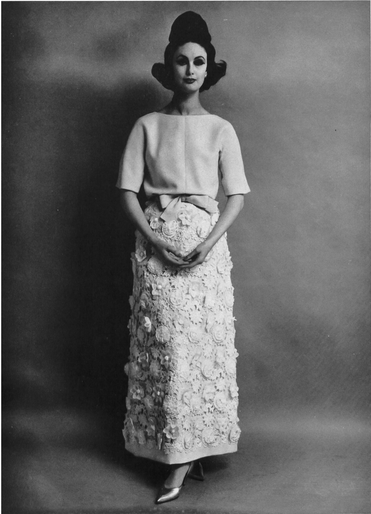
JEAN PATOU Organdi brodé avec motifs appliqués de A. Naef & Cie S.A., Flawil / Saint-Gall Grossiste à Paris: Pierre Brivet, S. à r.l.