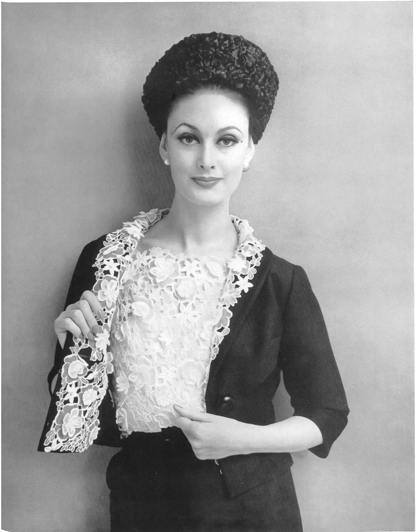
JEAN DESSÈS Galon d'organdi découpé de Forster Willi & Co., Saint-Gall Grossiste à Paris: Pierre Brivet, S.à r.l.