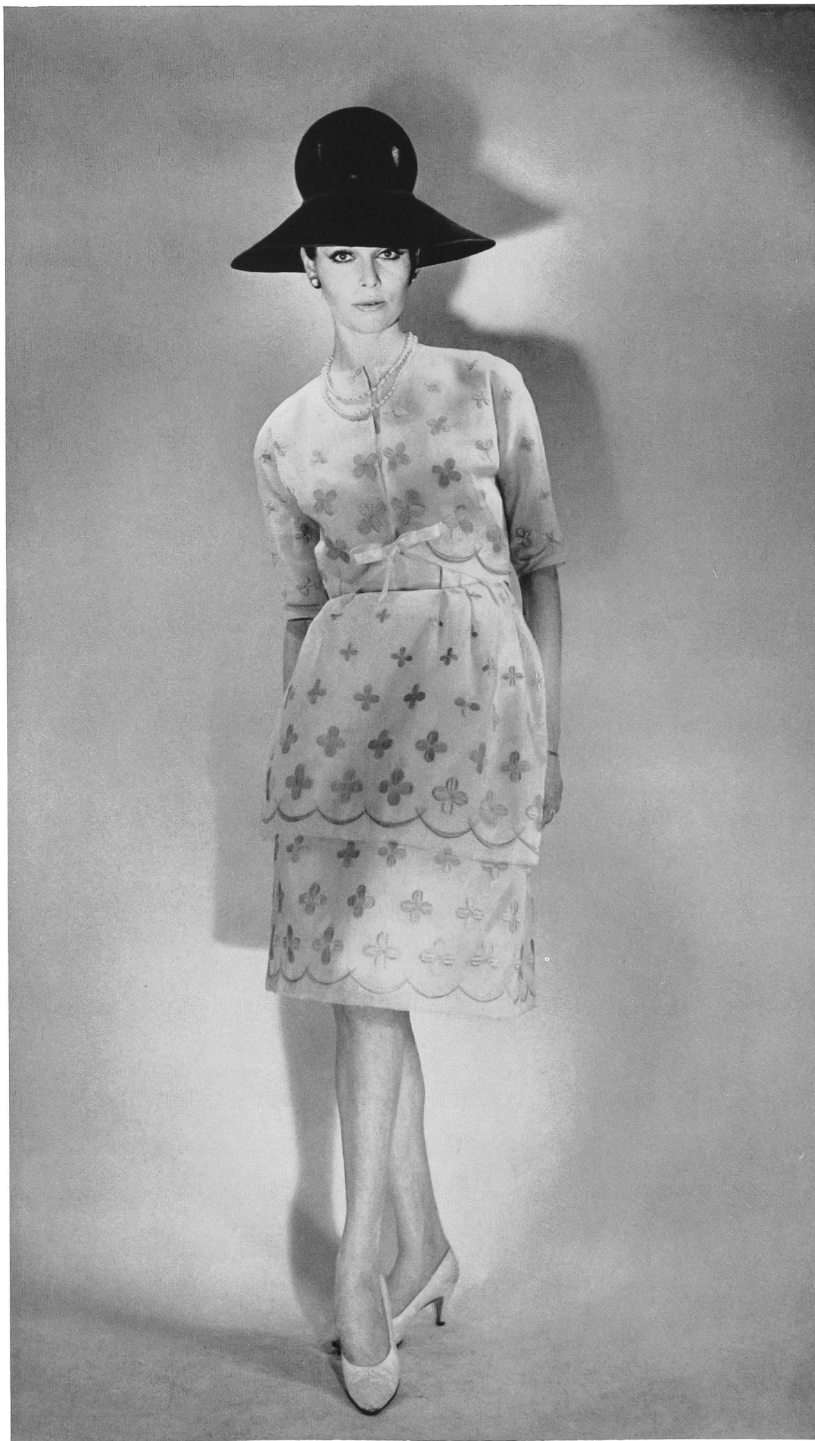
BERNARD SAGARDOY Laize d'organdi de soie brodé couleur de Union S. A., Saint-Gall