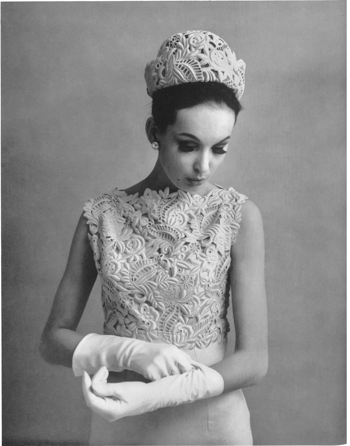
PIERRE BALMAIN Galon découpé de Forster Willi & Co., Saint-Gall