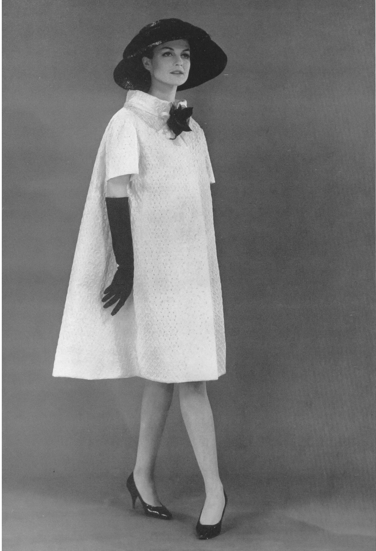
JACQUES HEIM Batiste Minicare blanche brodée de Reichenbach & Co., Saint-Gall