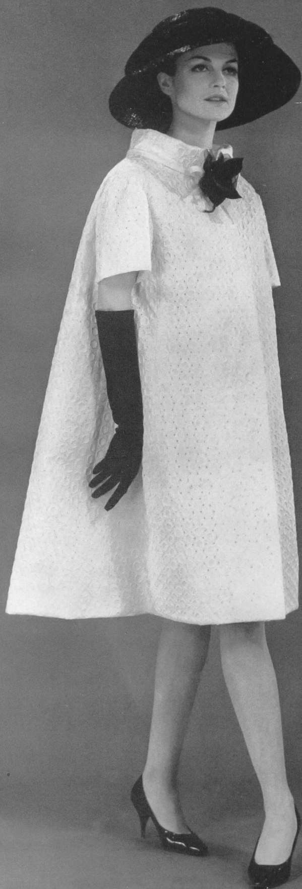
JACQUES HEIM Batiste Minicare blanche brodée de Reichenbach & Co., Saint-Gall