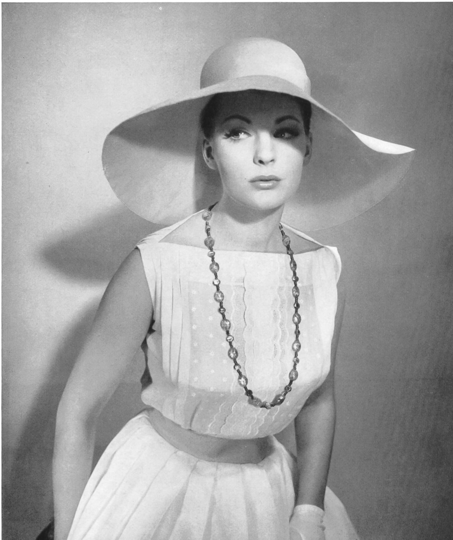
GUY LAROCHE « Nelo », broderie coton « Belrosa » Minicare de J. G. Nef & Co. S. A., Hérisau