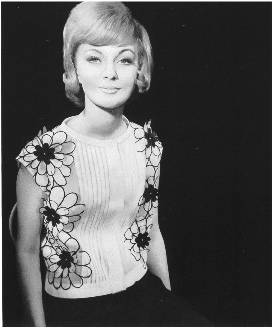
BERNARD SAGARDOY Laize d'organdi avec application de motifs découpés de Union S. A., Saint-Gall