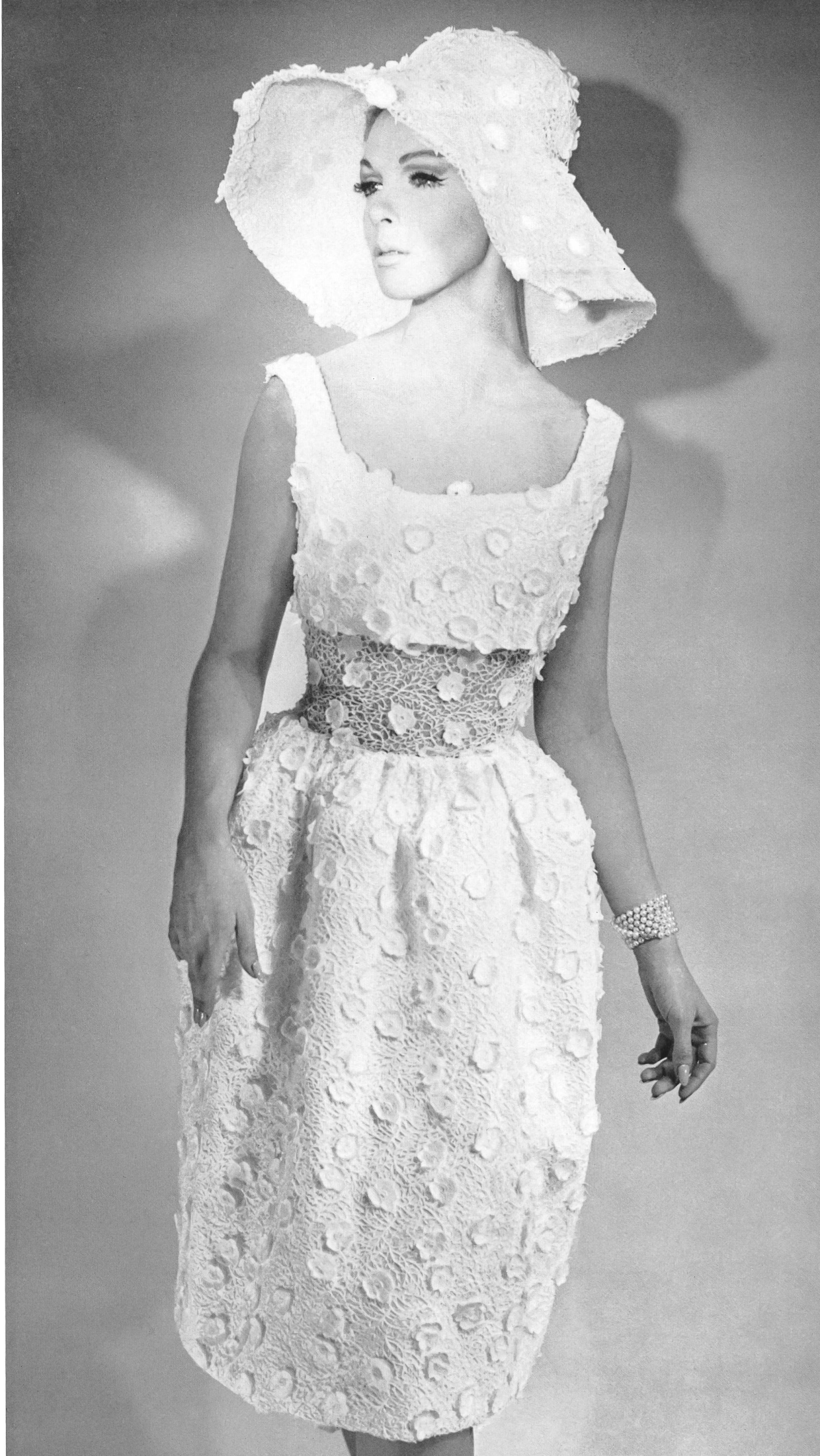
GUY LAROCHE Dentelle de guipure riche de Forster Willi & Co., Saint-Gall Grossiste à Paris : Robert Burg & Cie