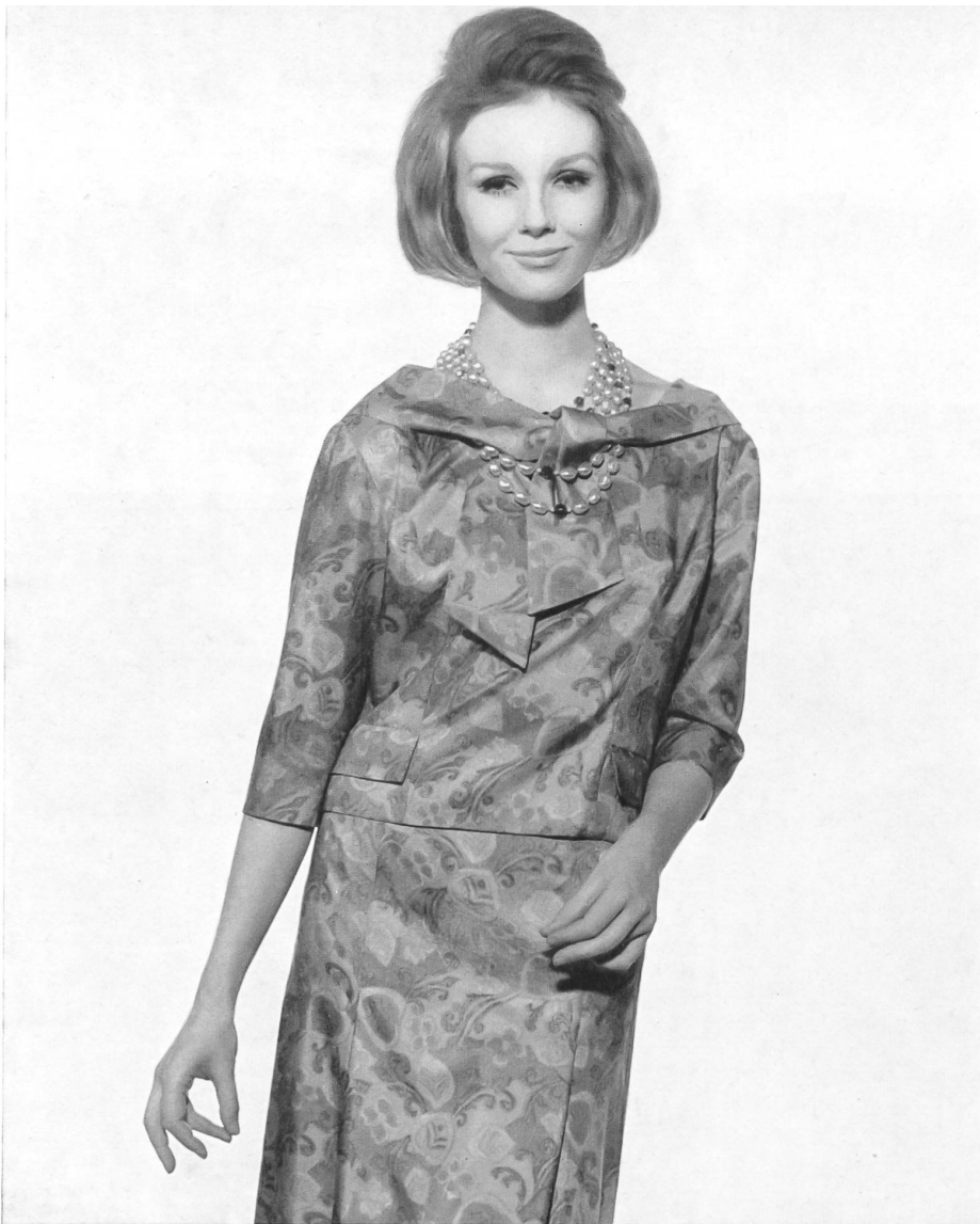
RÉGINE LUTÈCE, PARIS Tissu « bégé-Oki Ama » pure soie de Bégé S. A., Tissus Nouveautés, Zurich Lahondès, grossiste exclusif, Paris