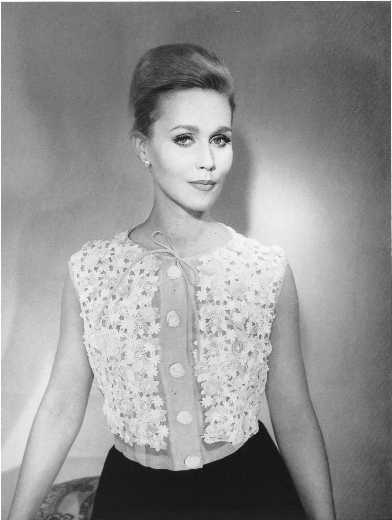
BERNARD SAGARDOY Organdi brodé avec fleurs superposées de A. Naef & Cie S. A., Flawil/Saint-Gall Grossiste à Paris: Robert Burg & Cie