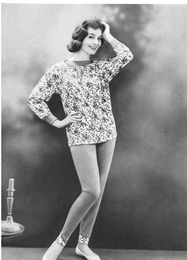
« SAWACO », S.A. W. ACHTNICH & CO., WINTERTHOUR

Les commerçants achetèrent surtout des produits mode et de haute qualité de l'industrie de la lingerie et du corset. Il y eut une forte demande pour les sous-vêtements mode, les « combi-slips », les vêtements de nuit, la lingerie en matières nouvelles et en coloris inédits. En corsets, les commandes allèrent principalement aux articles qui présentaient des caractéristiques nouvelles et dans la ligne de la mode en matière de coloris, de coupe et d'exécution. A part le blanc, couleur dominante, beaucoup de commandes vont aux corsets noirs ainsi qu'aux écossais peu appuyés. Au cours du défilé international de mode, qui eut lieu dix fois en tout au cours des trois jours que dura la foire, ce furent environ quatre-vingts modèles de lingerie et de corsets qui furent présentés.