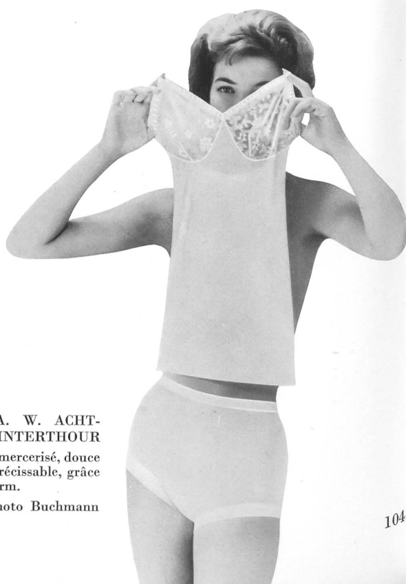
« SAWACO », S.A. W. ACHTNICH & CO., WINTERTHOUR Parure en fil retors mercerisé, douce au toucher et irrétrécissable, grâce au finissage Fixform.