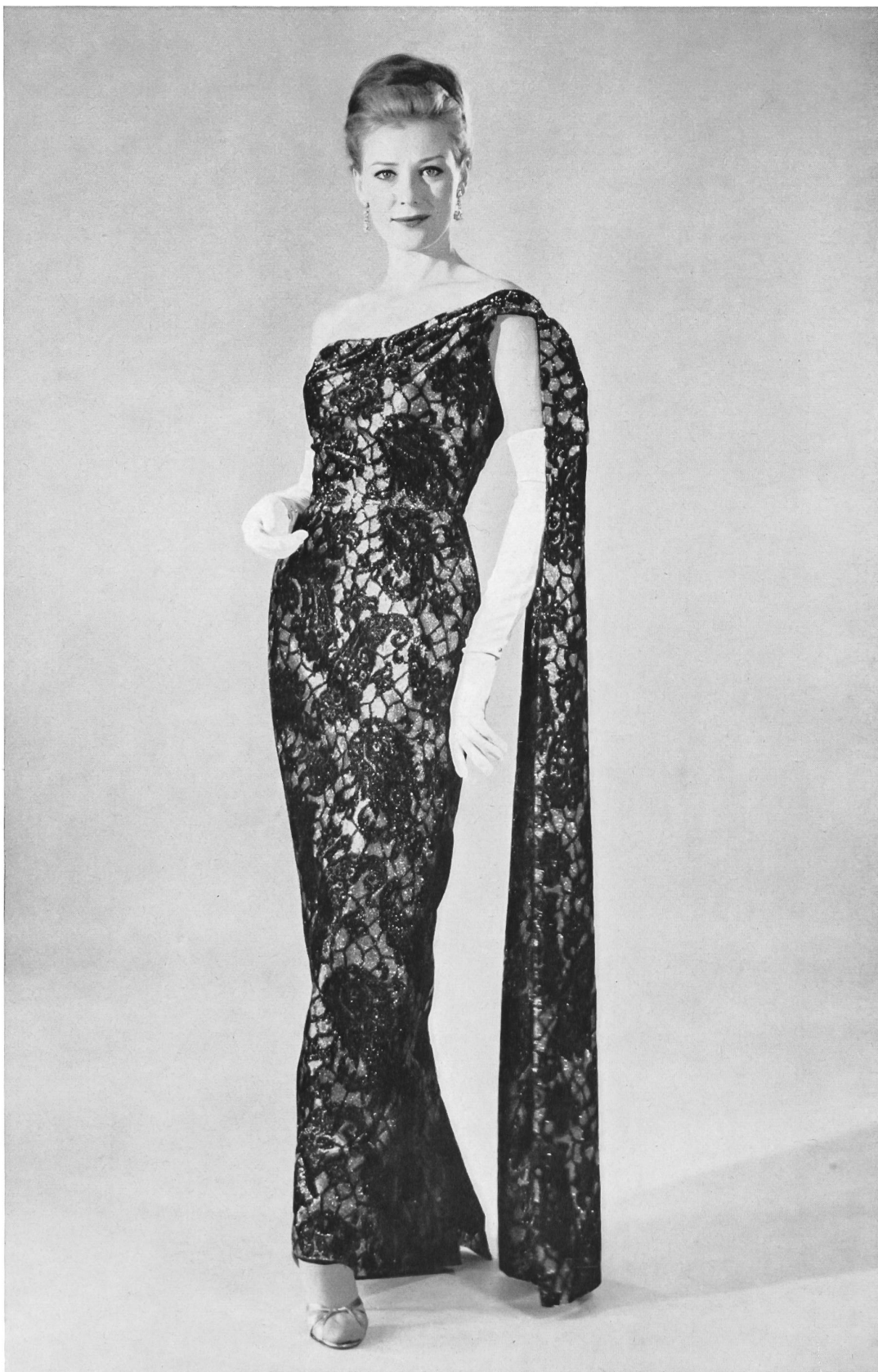
« MIRA », H. GROSSENBACHER S.A., ZURICH Robe du soir en velours lamé, noir et or. Evening gown in black and gold lamé velvet. Vestido de soaré de terciopelo escarchado negro y oro. Abendkleid aus schwarz/goldenem Lamé-Samt.