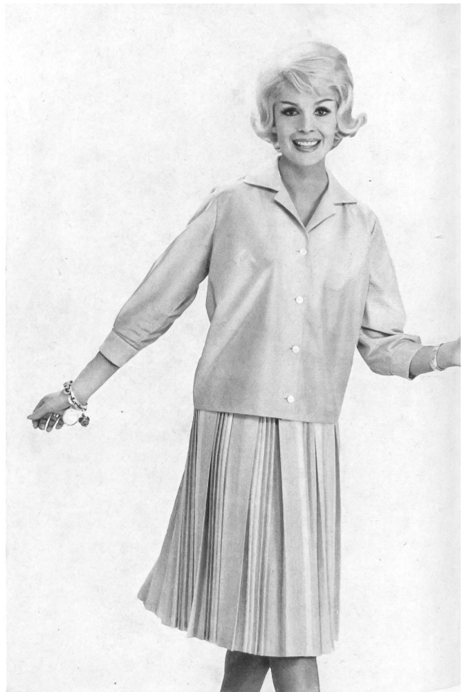
HEER & CIE S. A., THALWIL Térylène (blouse et jupe) Modèle « Fleurisse », Adolf Merz-Brand, Herisau