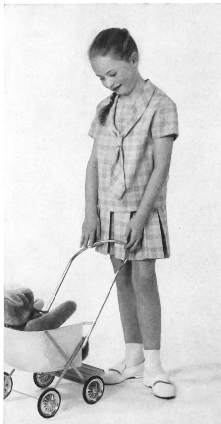
HEER & CIE S. A., THALWIL Térylène/laine Modèle Eugen Oertle & Cie, Saint-Gall