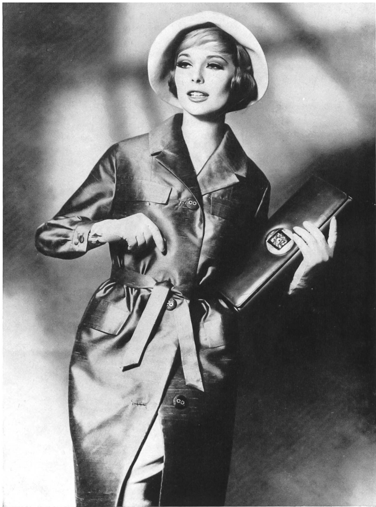
HEER & CIE S. A., THALWIL Shantung pure soie Imperméable de Dumas, Egloff S. A., Châtel-Saint-Denis