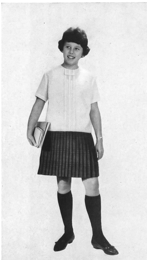
HEER & CIE S. A., THALWIL Térylène/laine (blouse et jupe) Modèle Leumann, Boesch & Cie S. A., Kronbühl