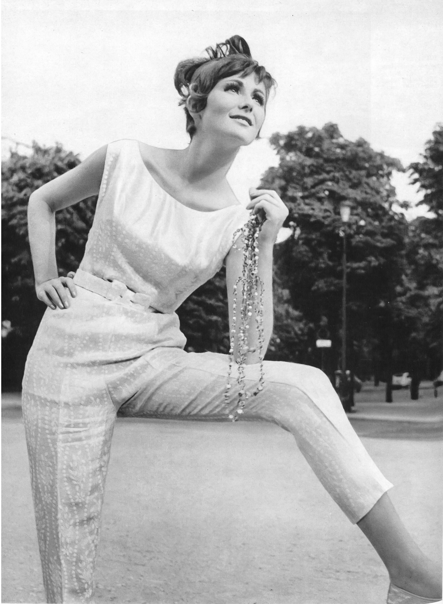
BERNARD SAGARDOY Façonné lamé, soie/métal, des Soieries Stehli S.A., Zurich