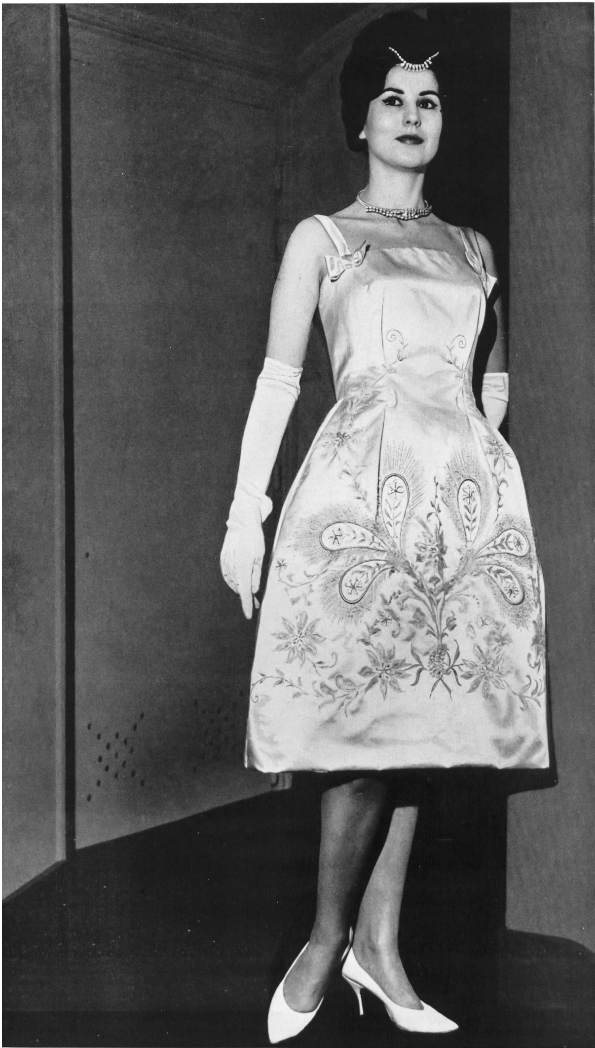
BOB BUGNAND Soie Rhodia, brodée de perles et main, de Rudolf Brauchbar & Cie S.A. Zurich Distribué par Montex, Paris