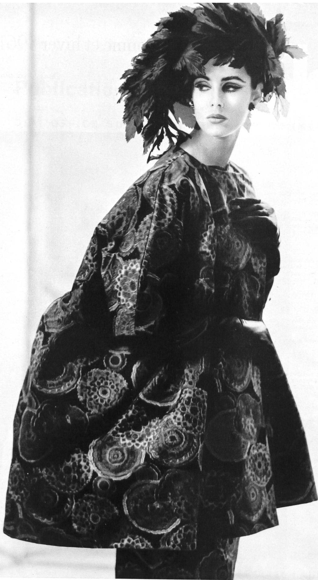
HUBERT DE GIVENCHY