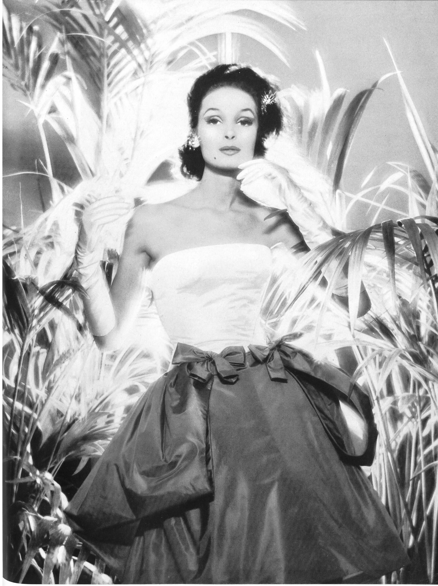
JACQUES ESTEREL Taffetas chiffon blanc et or de Robt. Schwarzenbach & Co., Thalwil