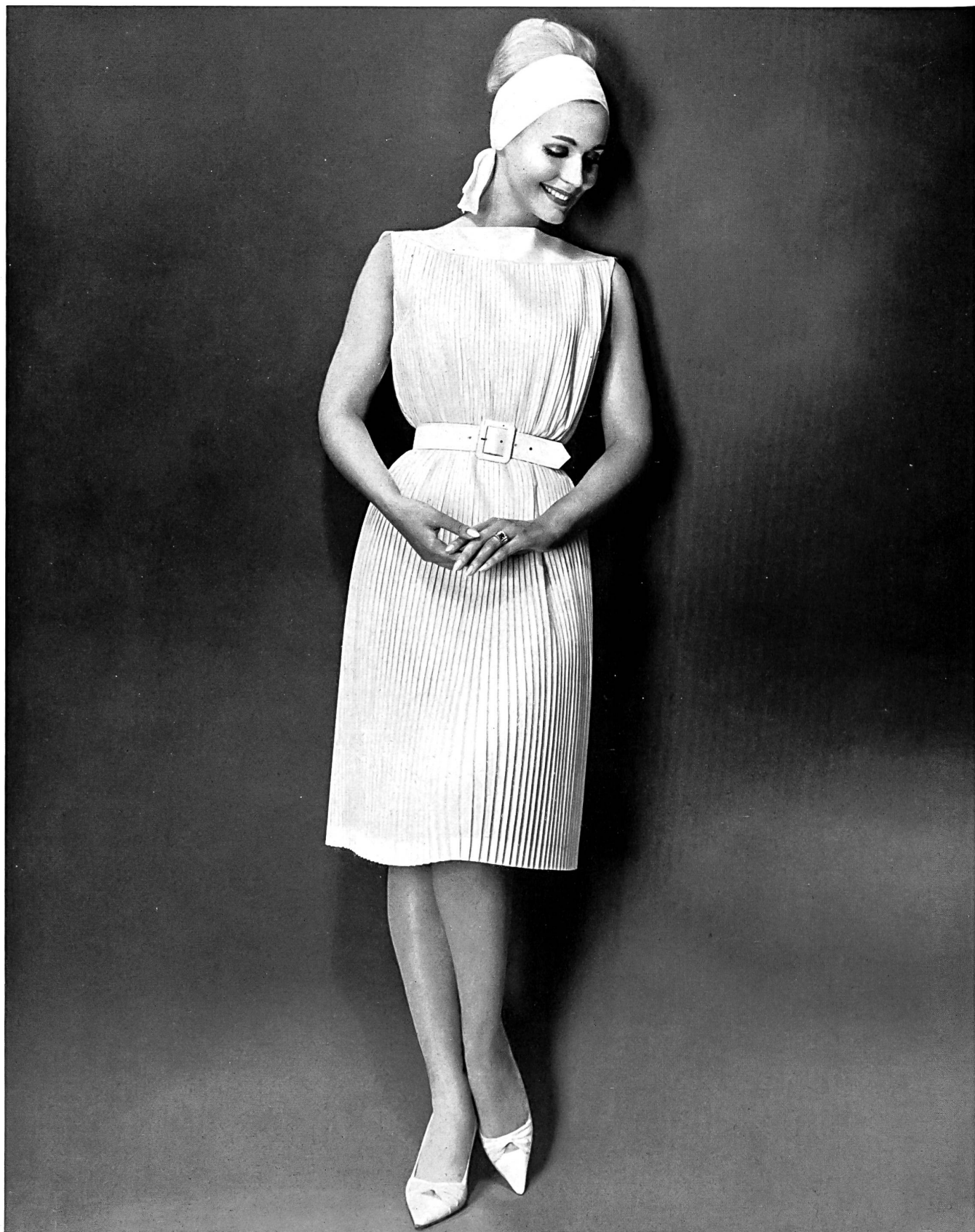
Elegantes Plissé-Kleid aus «Stoffels» Terylene

Nous présentons notre collection à l'Hôtel Central, à Zurich Tél. (051) 32 68 20