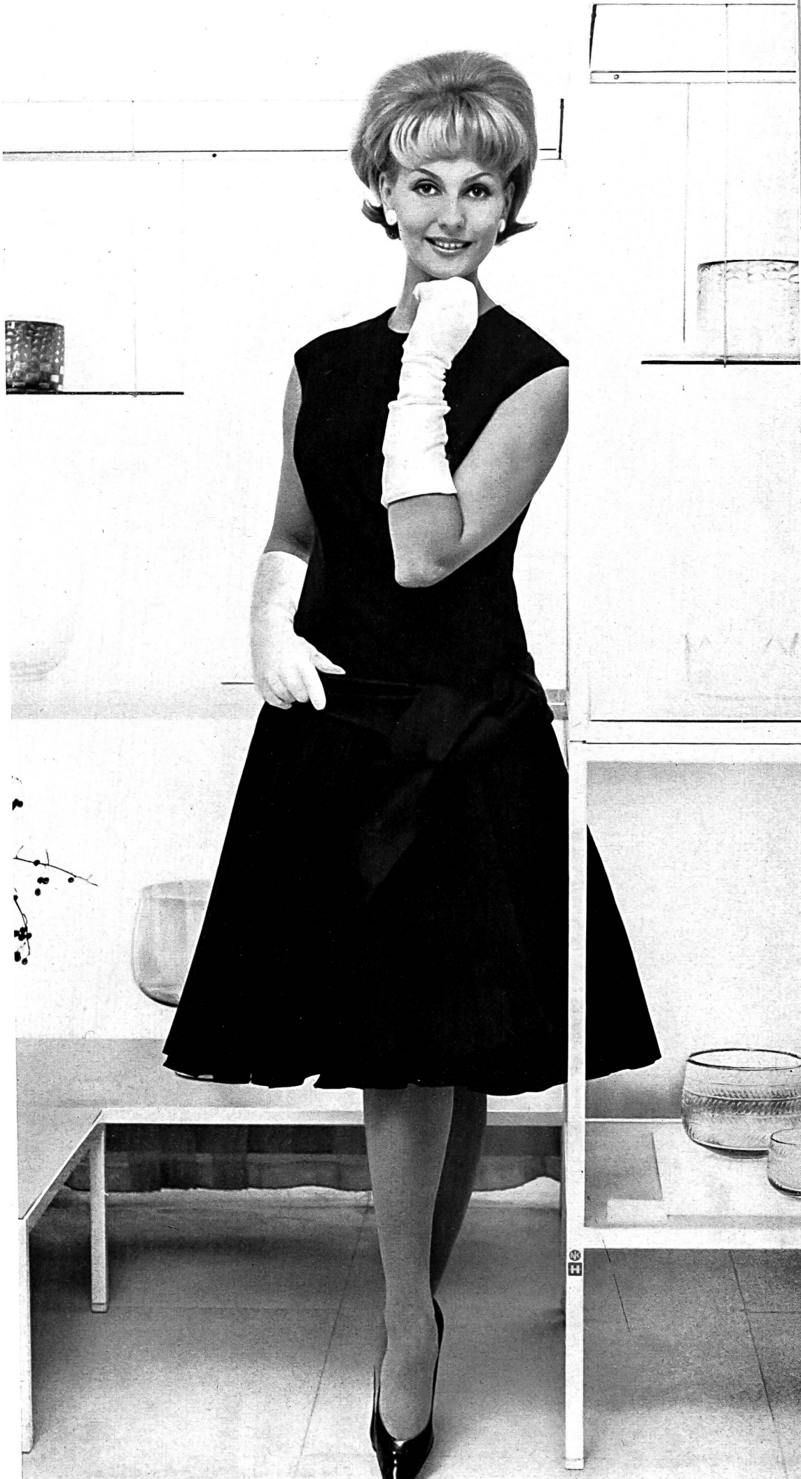
HEER & CIE S. A., THALWIL Mohair satin Modèle Salén A.B., Stockholm