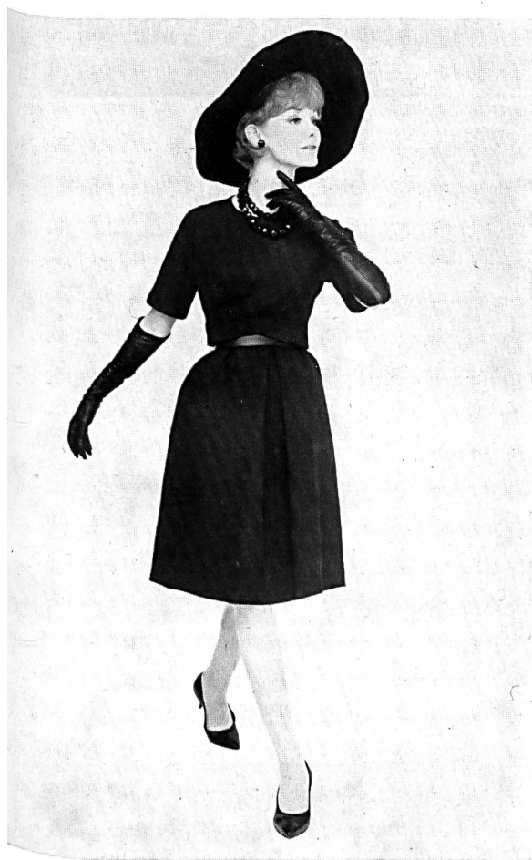
Tissu de coton noir de Saint-Gall Modèle Teal Traina, New York