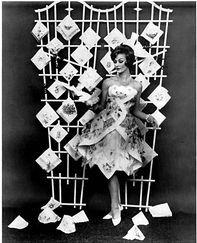
Création Anny Couture, Bâle réalisée au moyen de 100 mouchoirs

Robes réalisées en mouchoirs de Saint-Gall imprimés, brodés ou bordés de dentelle, qui sont présentées dans les grands magasins étatsuniens à l'occasion de campagnes en faveur de ces articles.