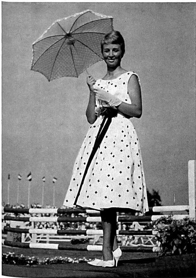
MACOLA S. A., ZURICH Robe de coton avec motifs brodés appliqués

Ci-contre nous reproduisons quelques vues prises à cette occasion.