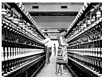
Filage sur métiers continus à anneaux