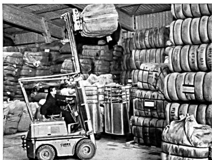
Entrepôts de laine