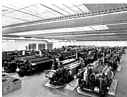
Salle de tissage moderne avec 100 métiers, dans une fabrique suisse de drap