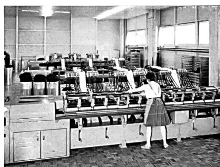
Machine ultra moderne pour l'étirage en fin dans une fabrique de laine peignée