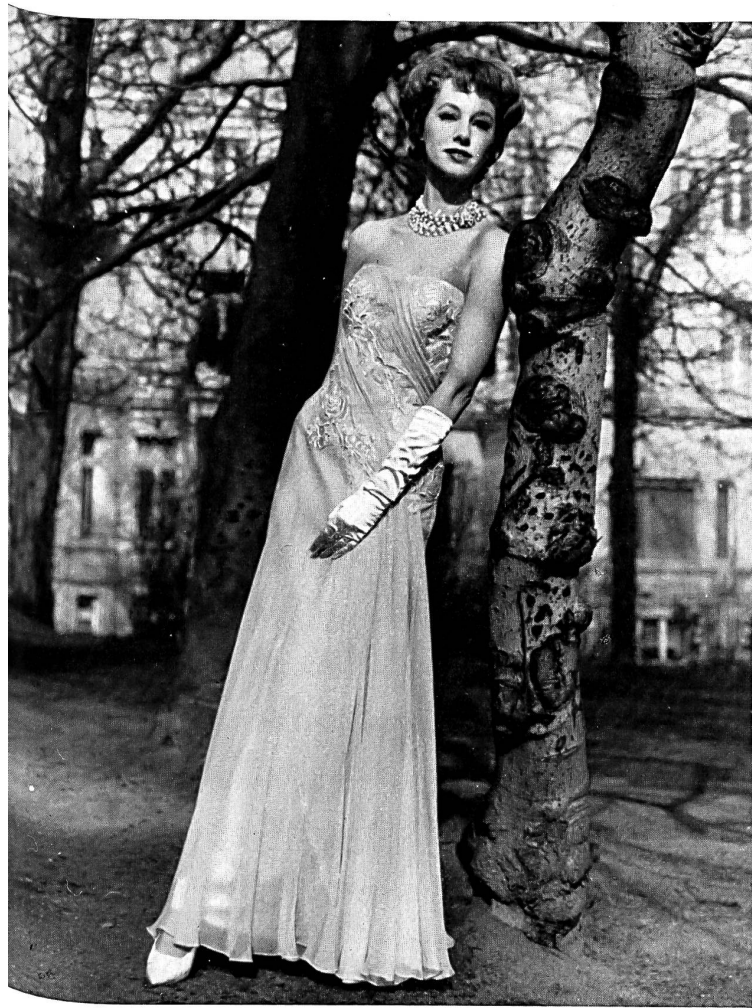
FORSTER WILLI & CO., SAINT-GALL

Applications de broderie Stickereiapplikationen Modell Charles Ritter, Hamburg-Lübeck