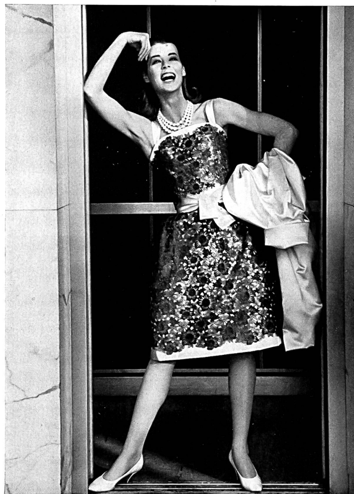
UNION S.A., SAINT-GALL

Applications de broderie Stickereiapplikationen Modell Charles Ritter, Hamburg-Lübeck