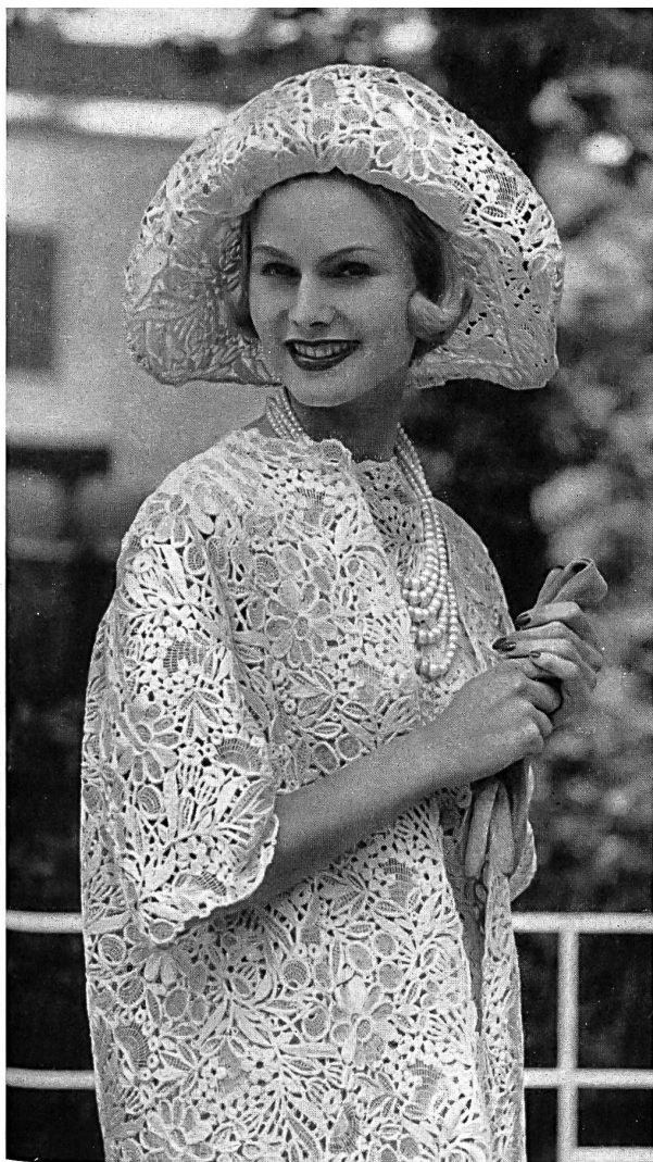
WALTER SCHRANK & CO., SAINT-GALL Guipure ficelle champagne Champagnefarbene Schnürliguipure Modèle Toni Schiesser, Francfort s/M.