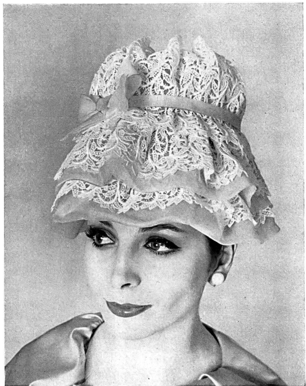
FORSTER WILLI & CO., SAINT-GALL Broderies et organdi suisses Swiss embroidery and organdie Modèle John Frederics