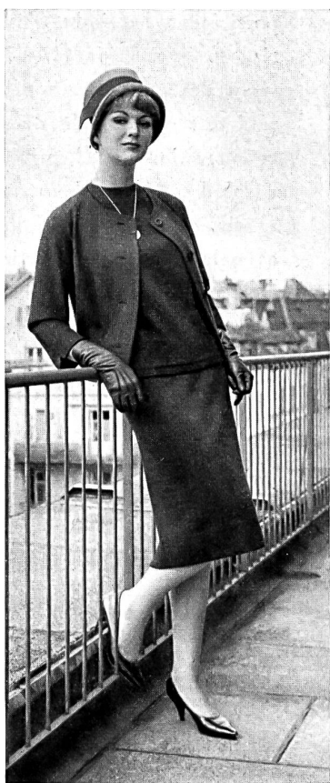
« SNAKY-BELFA » OUMANSKY & CO., GENÈVE Trois-pièces tricot Three-piece knitted outfit Tres piezas de punto