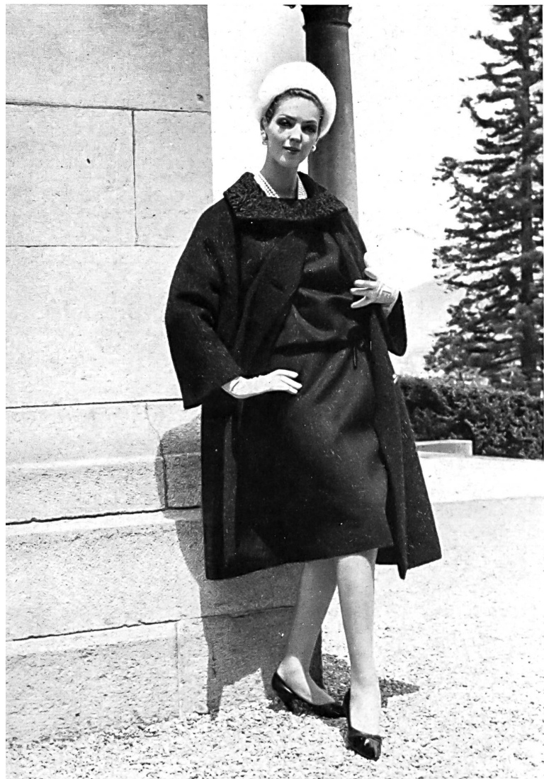
ARTHUR SCHIBLI S. A., GENEVE Robe noire avec manteau assorti Black dress with coat to match Vestido negro con abrigo haciendo juego Schwarzes Kleid mit passendem Mantel

ments de mailles, d'imperméables, de vêtements pour l'après-ski, les sports d'hiver et la plage. Pendant l'apéritif, les assistants eurent l'occasion d'examiner une exposition de lingerie ; après le déjeuner, ce furent le tour des manteaux, costumes, deux-pièces, robes, robes d'après-midi tricotées, blouses et articles pour enfants de défilé. Puis, ce fut l'heure du thé, et après celui-ci, il y eut encore une présentation de robes de cocktail et du soir. Le programme se terminait par un cocktail et un dîner. Nous reproduisons ci-contre quelques vues d'atmosphère, prises lors de cette manifestation réussie en tous points.