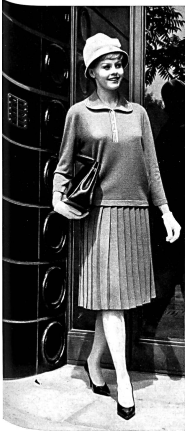
« ALPINIT » RUEPP & CIE S.A., SARMENTSTORF Ensemble tricot Knitwear outfit Conjunto de punto