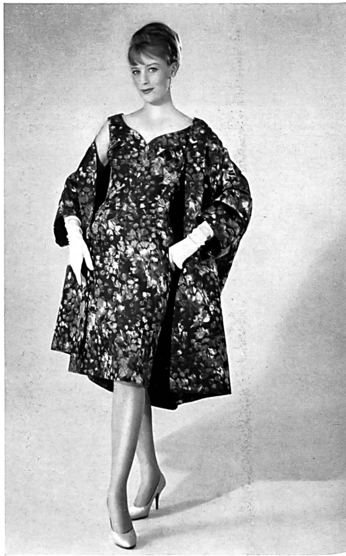
H. HALLER & CO., ZURICH Ensemble en jacquard pure soie Pure silk jacquard outfit Conjunto de tejido jacquard seda pura Complet aus reinseidenem Jacquard Gewebe