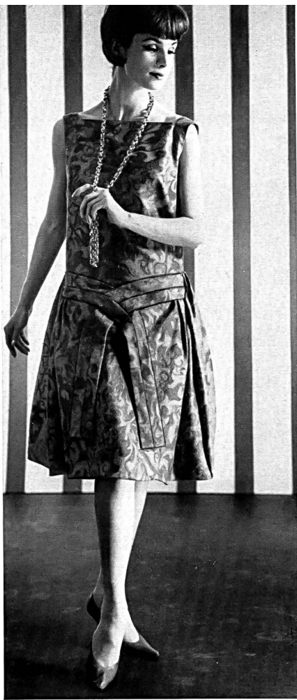
CHRISTIAN FISCHBACHER CO., SAINT-GALL Tissu de coton structuré imprimé Modèle Couture Marianne, Saint-Gall