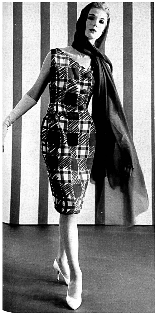
CHRISTIAN FISCHBACHER CO., SAINT-GALL Tissu de coton structuré imprimé Modèle Jeanpalmério, Zurich