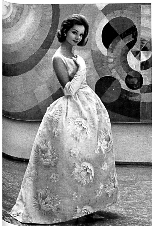
A. NAEF & CIE, FLAWIL Broderie - Embroidery - Bordado - Stickerei Modèle Mira, H. Grossenbacher AG., Zurich