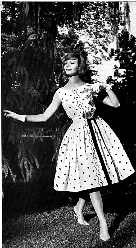
UNION S.A., SAINT-GALL Broderie - Embroidery - Bordado - Stickerei Modèle Macola AG., Zurich