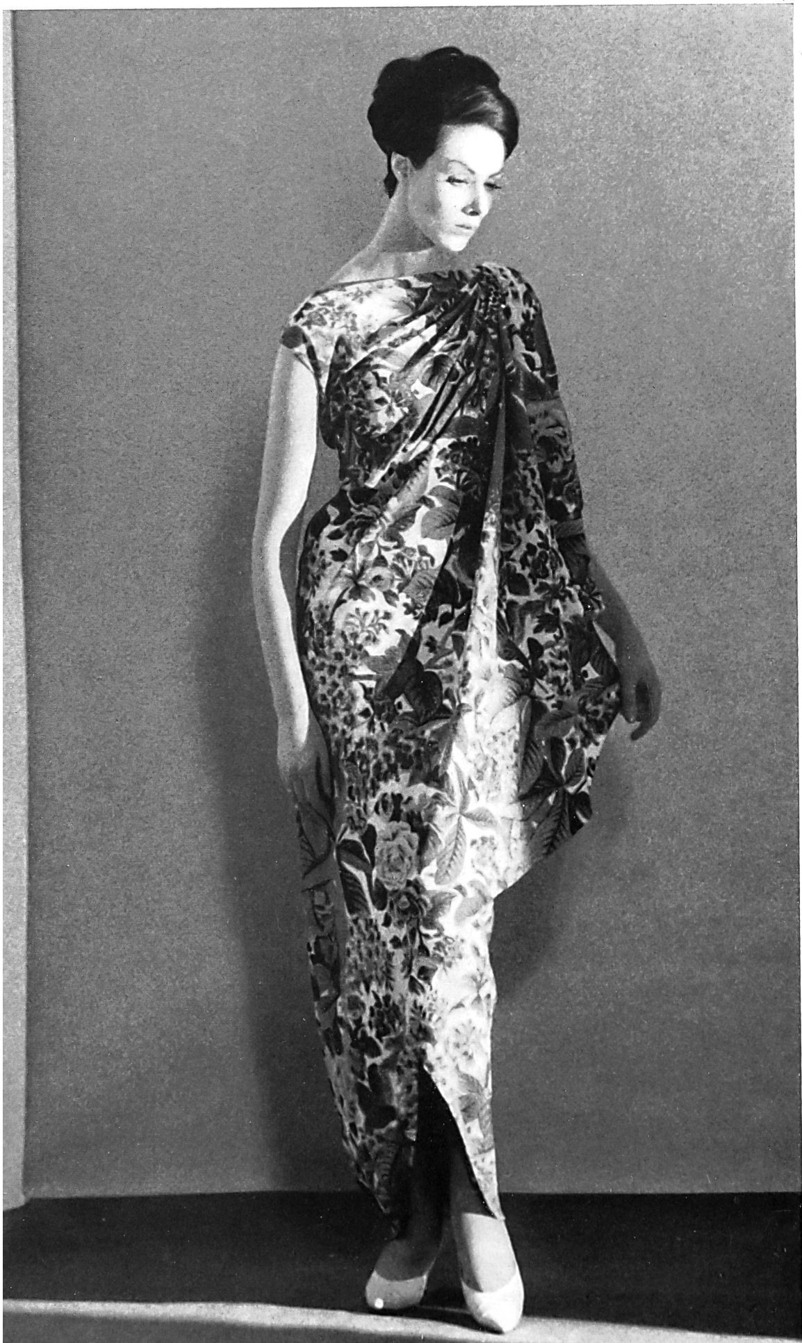
PIERRE BALMAIN « Basra » brodé de L. Abraham & Cie, Soieries S. A., Zurich