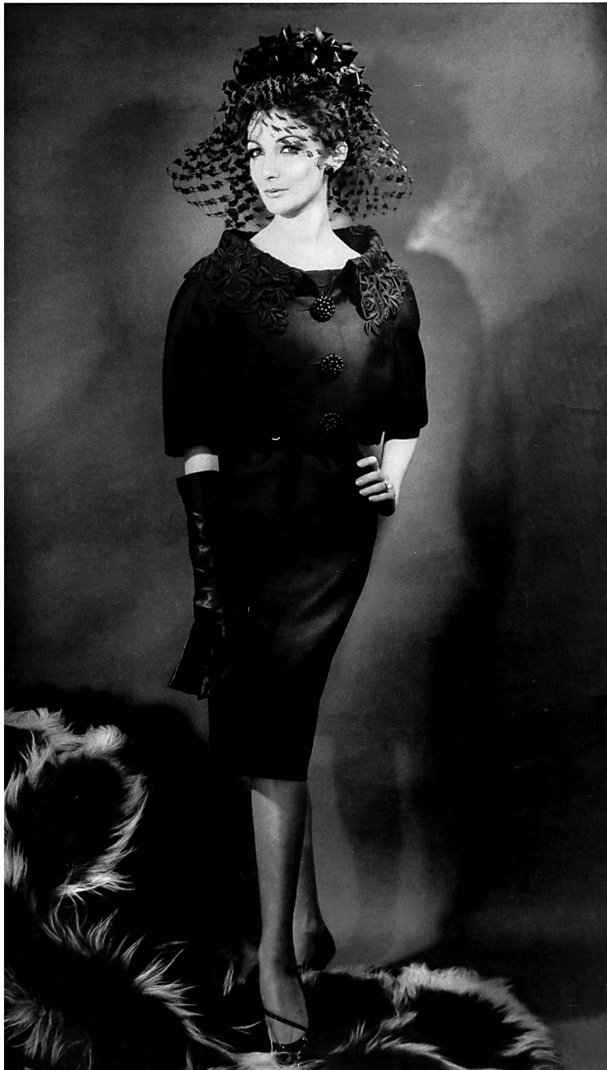
BERNARD SAGARDOY Broderie noire découpée de Union S. A., Saint-Gall Grossiste à Paris: Robert Burg & Cie