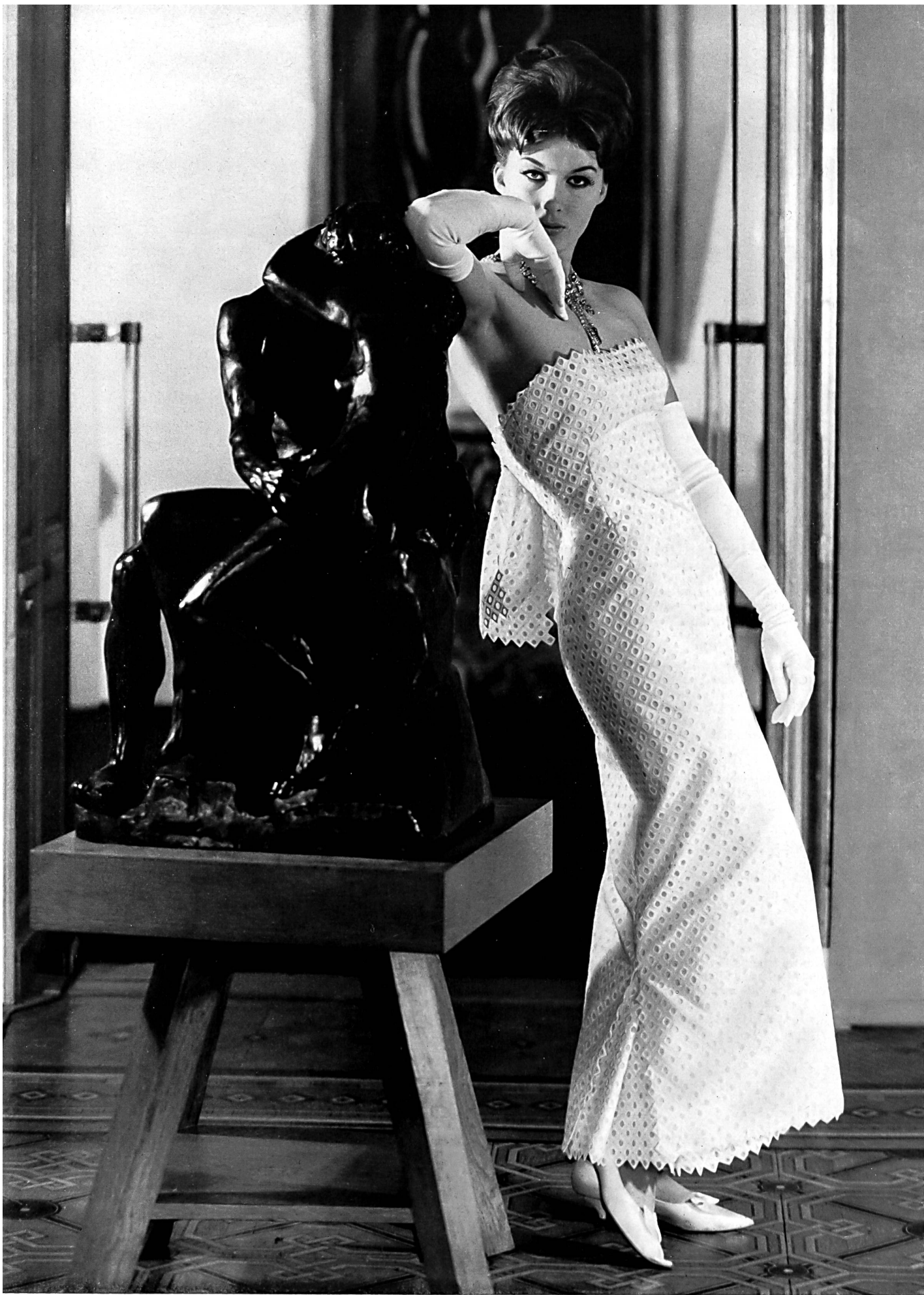
CARVEN Linen brodé de Forster Willi & Co., Saint-Gall Grossiste à Paris: Pierre Brivet S. à r. l.