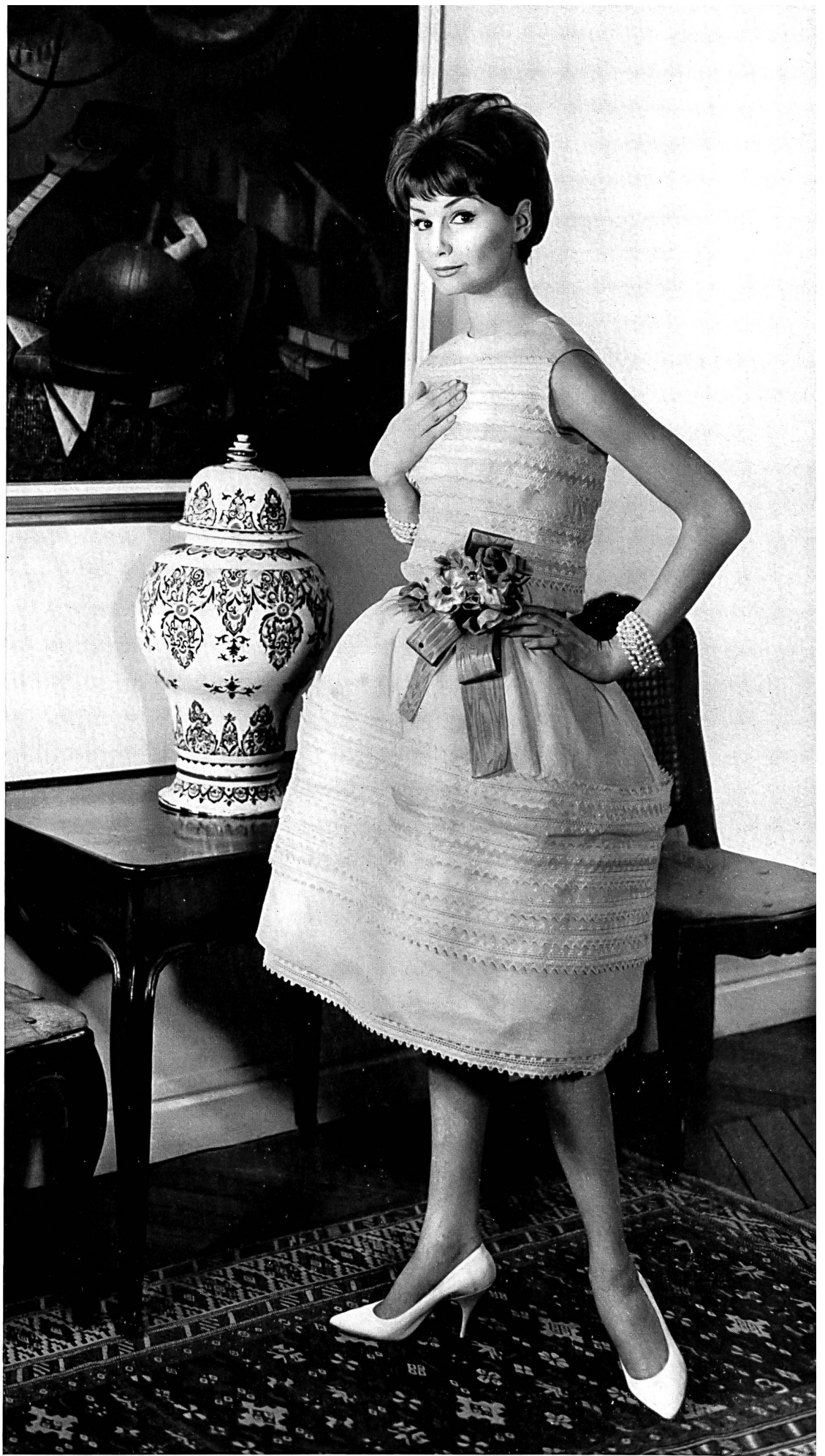
CHRISTIAN DIOR Organdi brodé de Forster Willi & Co., Saint-Gall