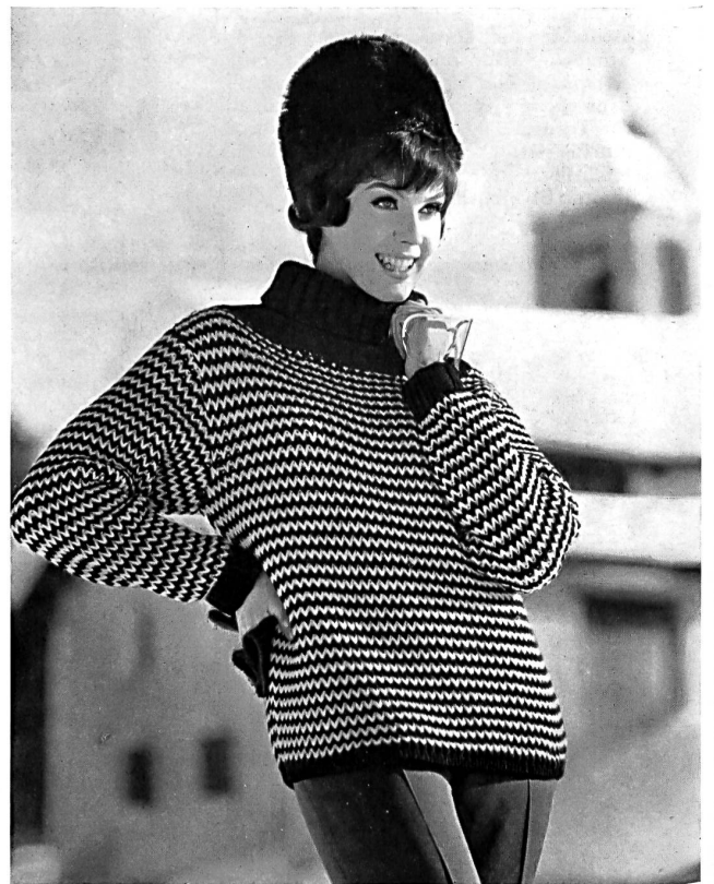
Pullover de sport et de ski en gros tricot bicolore, à col roulé monté très bas

vrières et d'ouvriers spécialisés travaillent avec soin et amour à la fabrication des modèles les plus divers de pullovers, jaquettes et robes, qui plus tard font la joie et l'orgueil d'innombrables femmes, dans deux douzaines de pays du monde entier.