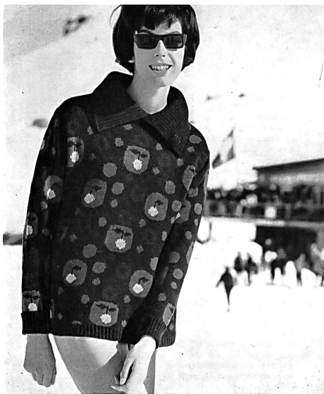
Pullover de ski en un dessin jacquard moderne, avec col mode à porter ouvert ou fermé

Un demi-siècle au service de la fabrication de tricots mode, voilà qui crée des obligations. Est-il donc étonnant que les produits de cette entreprise soient connus non seulement pour leur qualité, mais aussi pour l'exclusivité et l'originalité des modèles ? Le programme de fabrication comprend aujourd'hui des sur-vêtements tricotés pour dames et messieurs, de genre mode, à commencer par les petits pullovers et jaquettes « fully fashioned », jusqu'aux pullovers et jaquettes de sport, où toutes les audaces sont permises, sans oublier les modèles classiques, combinés partiellement avec du daim de haute qualité, les pullovers de ski d'un chic très raffiné et les robes, les deux-pièces et les costumes très élégants en tricot. Ajoutons que « Tanner » passe pour un des meilleurs producteurs en matière de tricots entièrement diminués ! C'est en 1954 que la fabrique prit livraison d'une énorme machine « Cotton » moderne, la première du continent européen, qui permit la production en séries de fins et douille pullovers et jaquettes entièrement diminués. A côté de ces mastodontes modernes, qui ne rappellent en rien le tricotage à la main, l'entreprise possède encore, dans sa fabrique de Saint-Gall Bruggen, un vaste parc de machines perfectionnées pour la fabrication de toutes sortes de produits. Dans des locaux vastes et bien éclairés, une troupe d'ou-