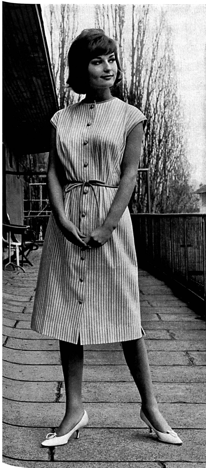
« YALA », JAKOB LAIB & CO., AMRISWIL

Jersey de coton Minicare — Minicare cotton jersey — Jersey de algodón Mini- care — Minicare Baumwolljersey « MINICARE », Joseph Bancroft & Sons Co. A.G., Zurich