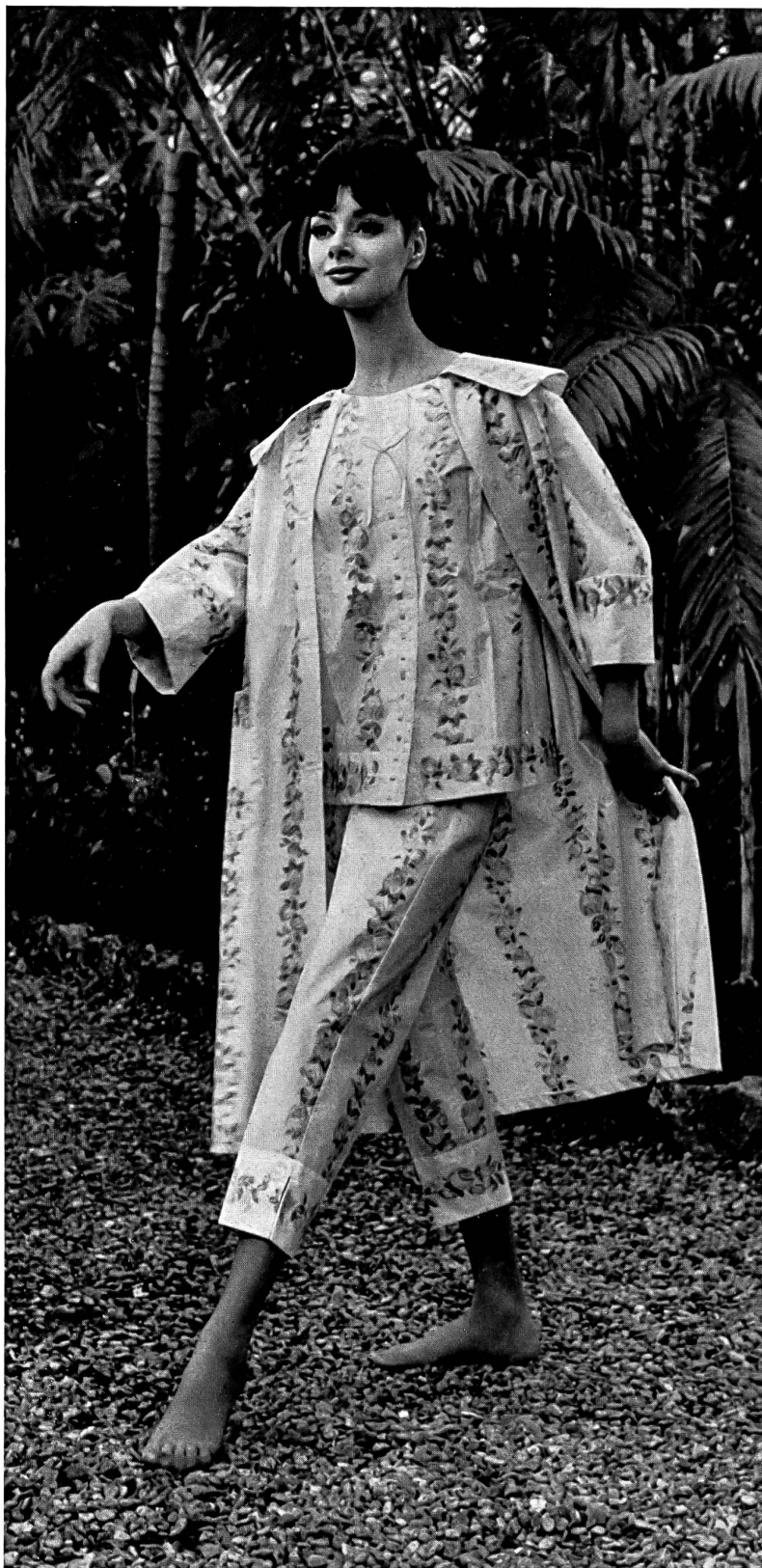
J. G. NEF & CO., S. A., HERISAU

Jersey de coton Minicare — Minicare cotton jersey — Jersey de algodón Mini- care — Minicare Baumwolljersey « MINICARE », Joseph Bancroft & Sons Co. A.G., Zurich