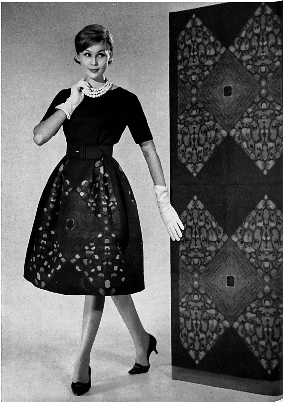
MAX KIRCHHEIMER FILS & CIE, ZURICH Coton d'hiver, dessin Jacquard d'un genre nouveau Winter cotton in a new style Jacquard design Algodón de invierno con dibujo Jacquard de estilo nuevo Winter cotton in neuartigem Jacquard dessin Modèle Cortesca S.A., Zurich