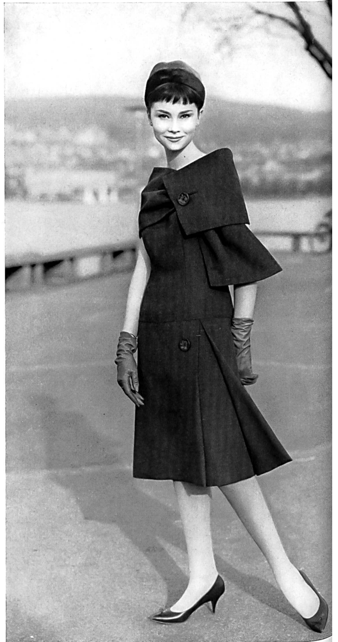
HEER & CIE S.A., THALWIL Rêve de Térylène Modèle Eugen Braunschweig S.A., Zurich