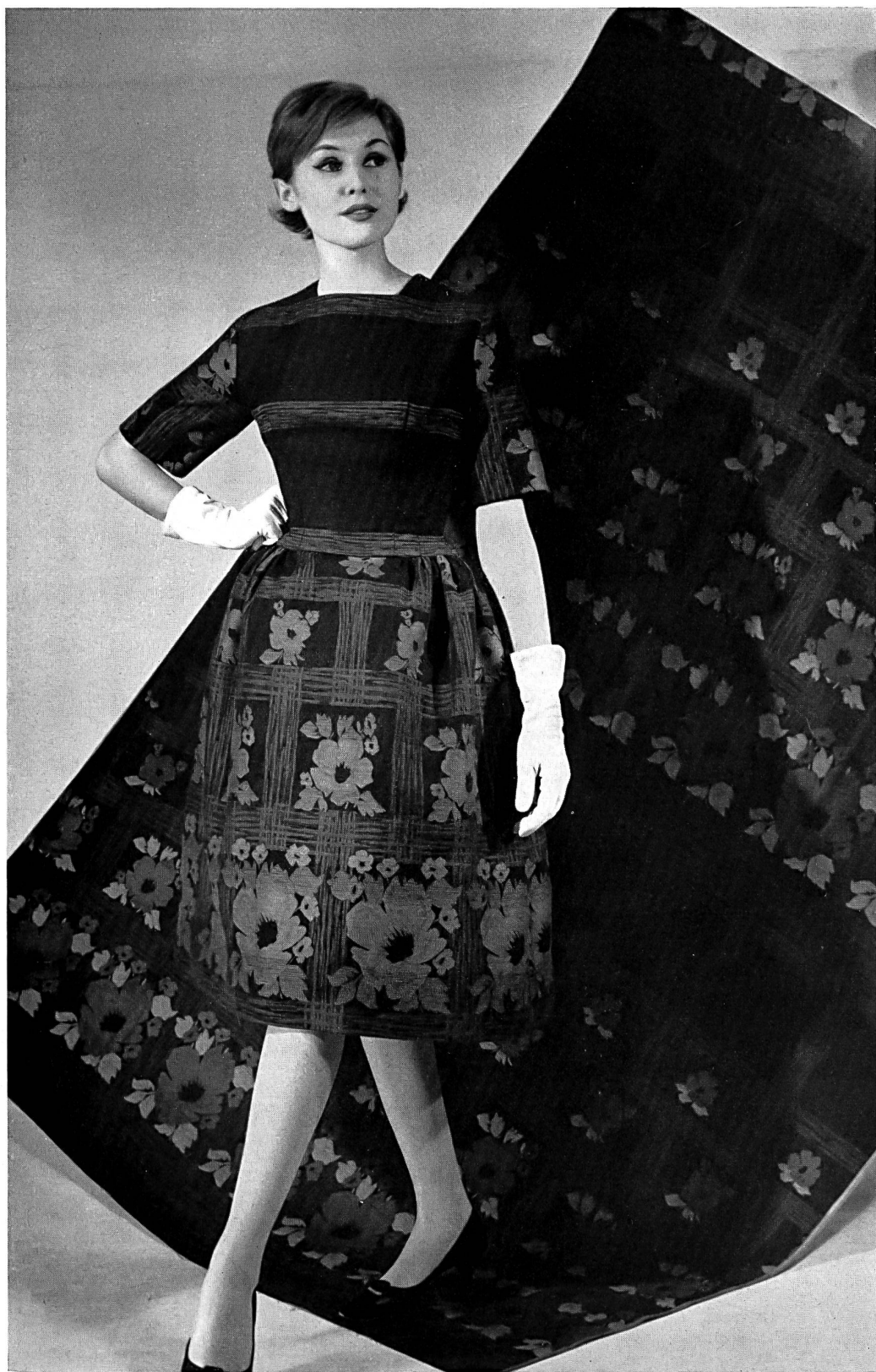
MAX KIRCHHEIMER FILS & CIE, ZURICH Coton d'hiver, dessin Jacquard d'un genre nouveau Winter cotton in a new style Jacquard design Algodón de invierno con dibujo Jacquard de estilo nuevo Winter cotton in neuartigem Jacquard dessin. Modèle Willy Meyer S.A., Zurich