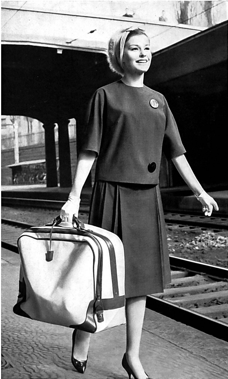
HEER & CIE S.A., THALWIL Rêve de Térylène Modèle R. Cafader & Cie S.A., Zurich