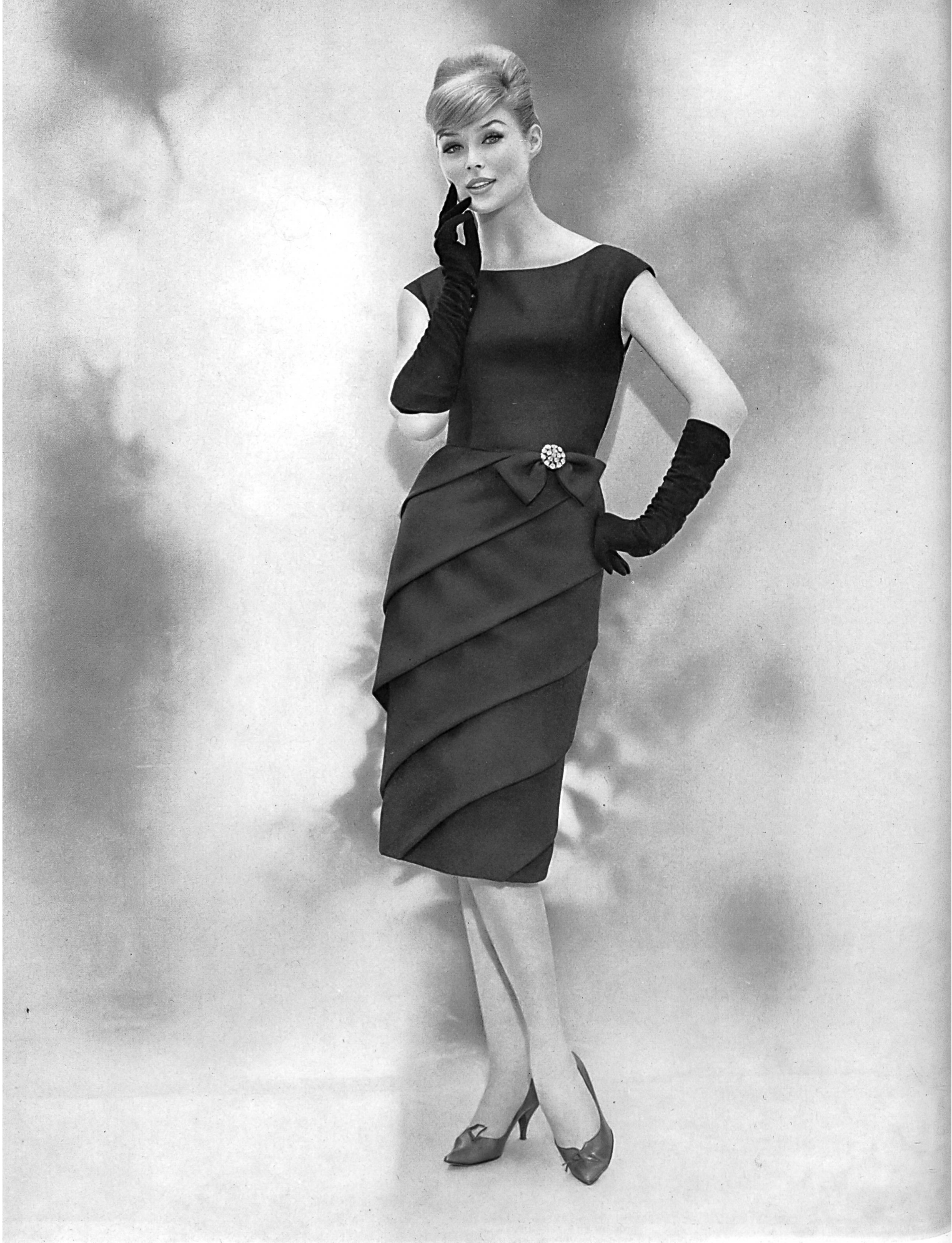
CUBEGA S.A., ZURICH « Cascade », Satin soie et laine / Silk and wool satin / Satén de seda y lana / Satin aus Seide und Wolle Modèle Eugen Braunschweig A.G., Zurich