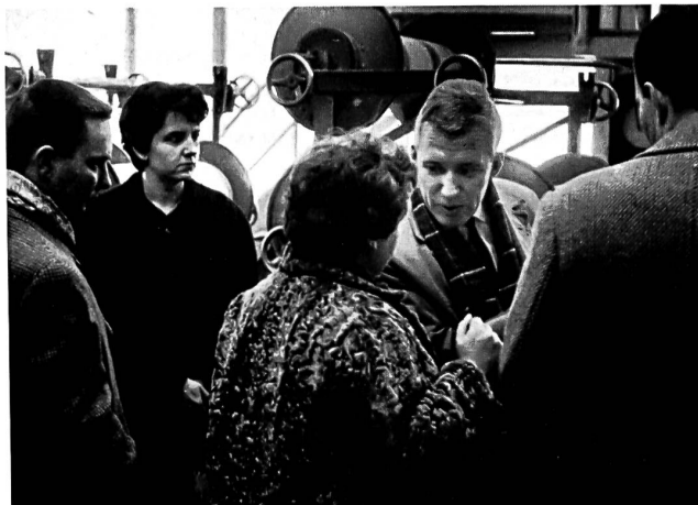
Visite des journalistes dans un tissage de coton (Meyer-Mayor Söhne, Neu St. Johann)