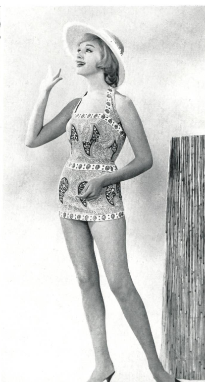
MYLORD S. A., CHATEL-SAINT-DENIS

Ensemble de loisirs en orlon « Hélanca »