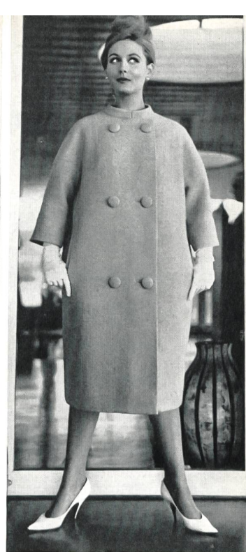
SCHMID A.G., GATTIKON Orlon/laine Modèle : Arthur Schibli S. A., Genève

à l'orlon, dans plusieurs pays. A cette manifestation participèrent, entre autres, un assez grand nombre de tricoteurs et de confectionneurs suisses et, indirectement, de fabricants suisses de tissus. Cette présentation, qui allait des maillots de bain aux robes de cocktail et manteaux, en passant par les pullovers et les ensembles de loisirs, donnait une idée complète des possibilités extrêmement variées de l'orlon dans la mode d'aujourd'hui.