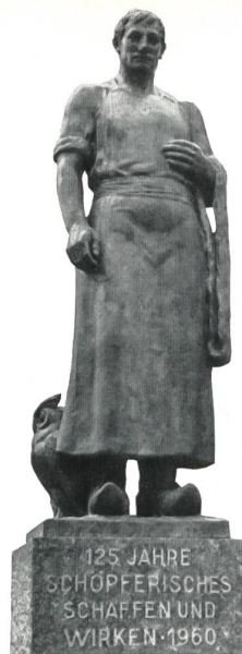
La statue du teinturier, sur la fontaine Heberlein, à Wattwil