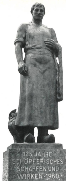
La statue du teinturier, sur la fontaine Heberlein, à Wattwil