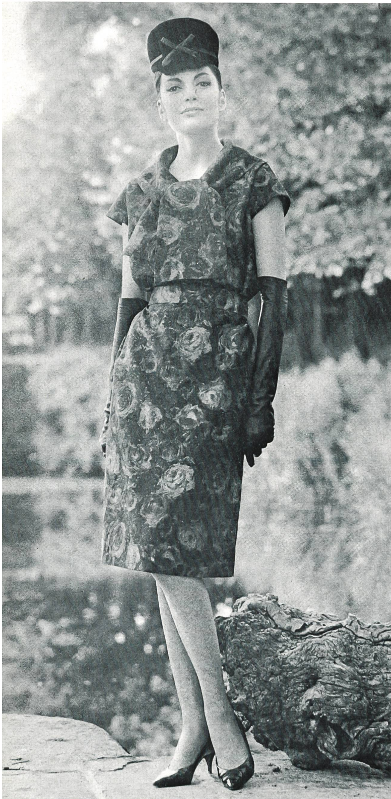
PIERRE CARDIN Soielaine « Miranda » de Reichenbach & Co., Saint-Gall Distribué par Montex, Paris