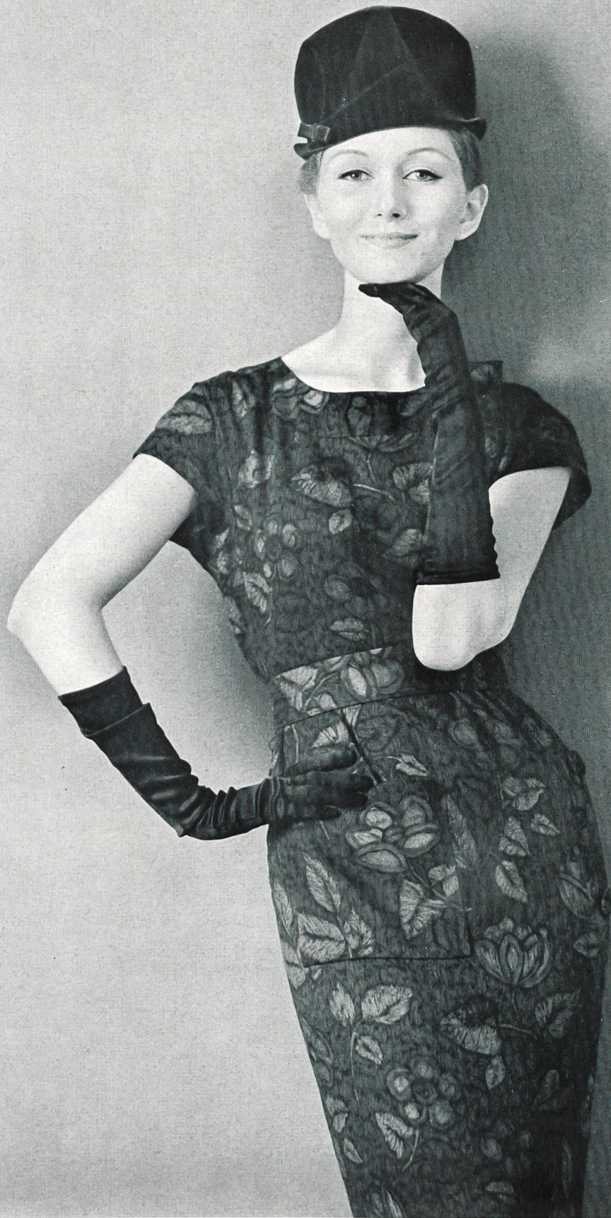
PIERRE CARDIN « Lavinia » de Reichenbach & Co., Saint-Gall Distribué par Montex, Paris