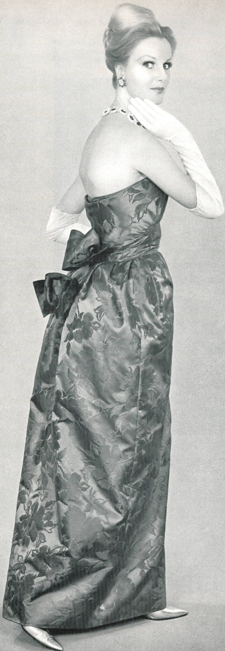
LANVIN CASTILLO Soie brochée « Damar » de L. Abraham & Cie, Soieries S.A., Zurich