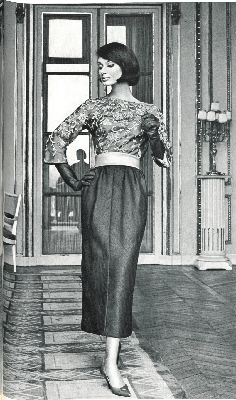
JACQUES HEIM Tissu « Kolibri » (soie naturelle) de Heer & Cie S.A., Thalwil Grossiste à Paris : Robert Burg & Cie