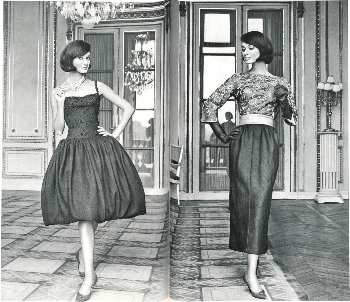
JACQUES HEIM Tissu « Kolibri » (soie naturelle) de Heer & Cie S.A., Thalwil Grossiste à Paris : Robert Burg & Cie