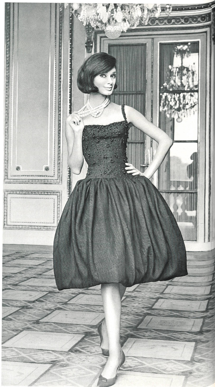
JACQUES HEIM Tissu « Kolibri » (soie naturelle) de Heer & Cie S.A., Thalwil Grossiste à Paris : Robert Burg & Cie