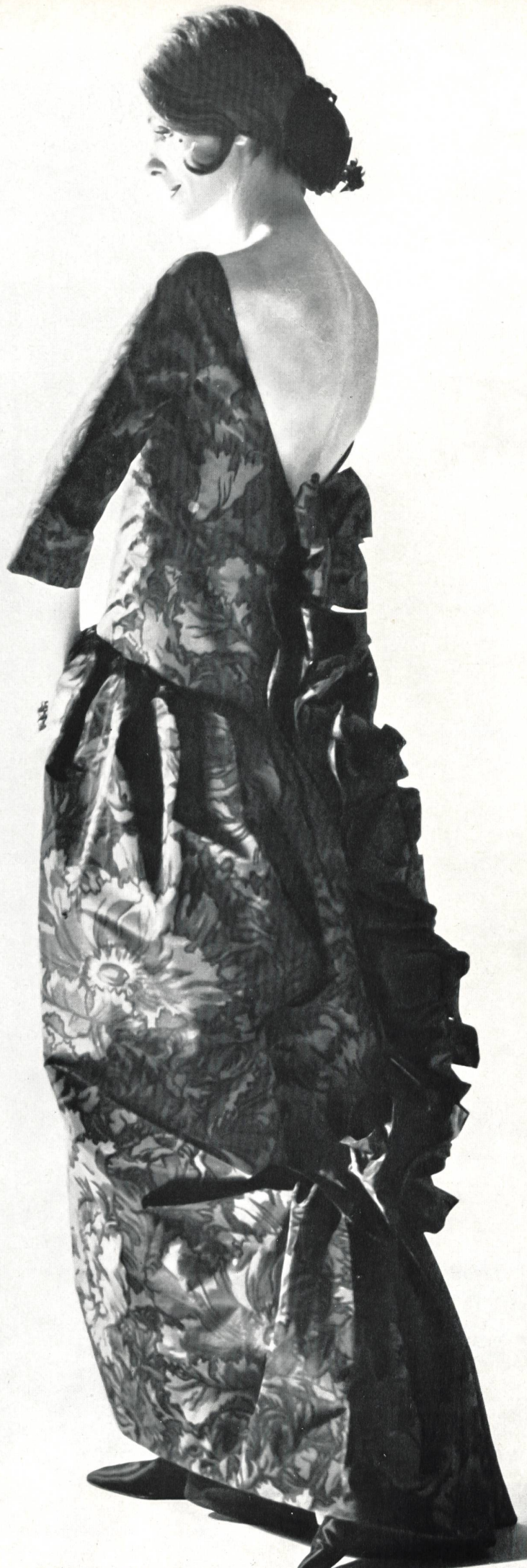
CHRISTIAN DIOR Taffetas imprimé sur chaîne de L. Abraham & Cie, Soieries S.A., Zurich