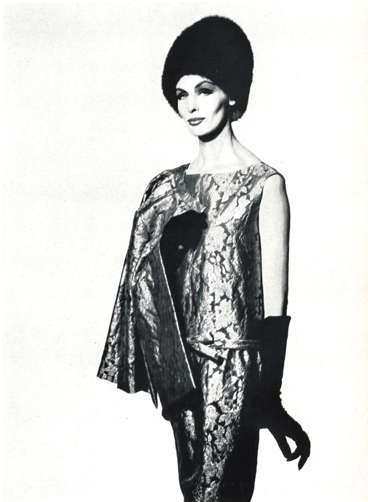
CHRISTIAN DIOR « Aragone » métal de L. Abraham & Cie, Soieries S. A., Zurich

MODÈLES EXCLUSIFS — REPRODUCTION INTERDITE