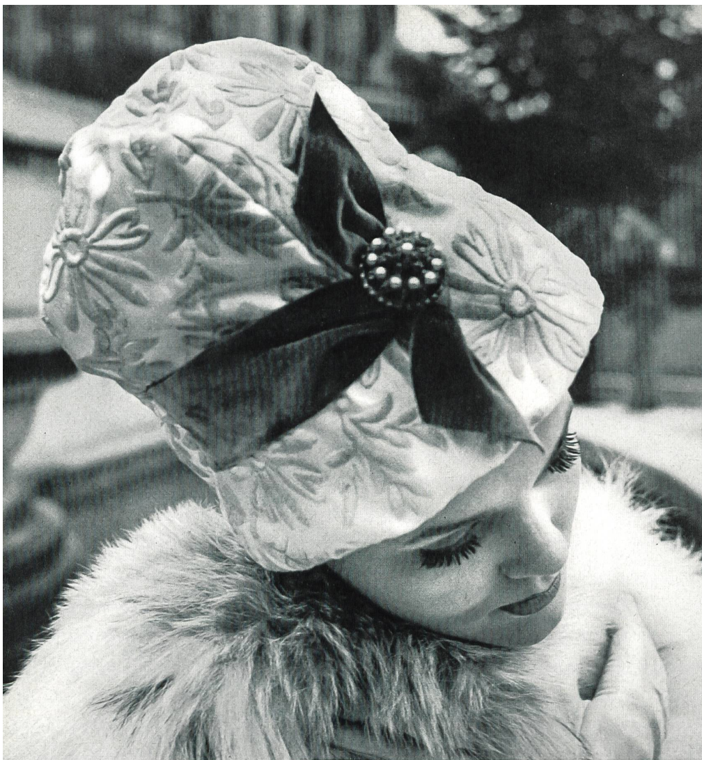
LANVIN CASTILLO Satin Duchesse brodé de Forster Willi & Co., Saint-Gall Grossiste à Paris : Robert Burg & Cie