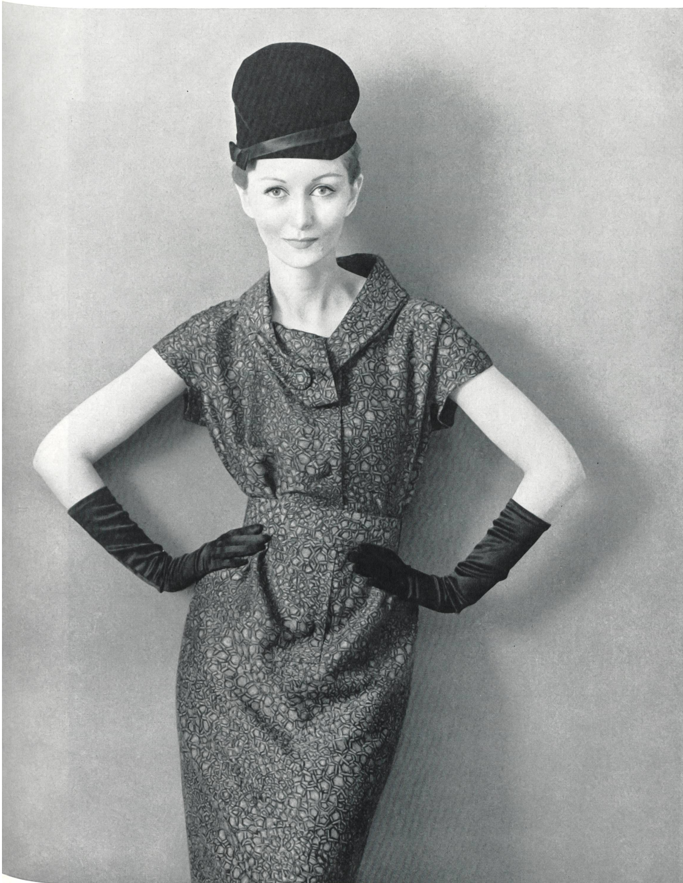
PIERRE CARDIN Soielaine « Miranda » de Reichenbach & Co., Saint-Gall Distribué par Montex, Paris