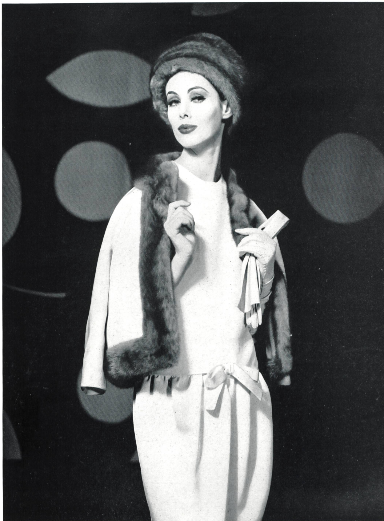
CHRISTIAN DIOR Gabardine de soie de L. Abraham & Cie, Soieries S.A., Zurich

MODÈLES EXCLUSIFS — REPRODUCTION INTERDITE