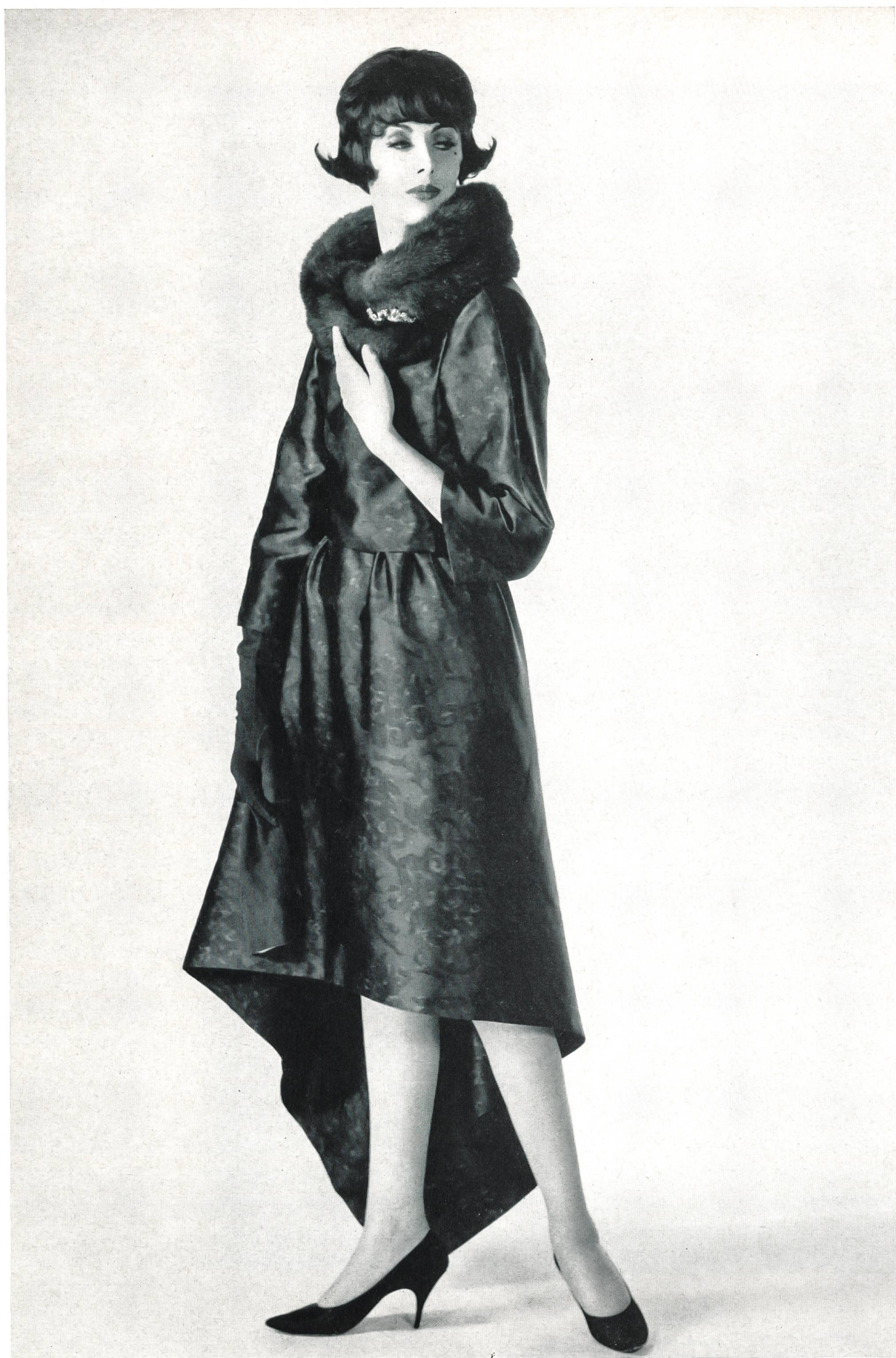
NINA RICCI Satin réversible imprimé sur chaîne de L. Abraham & Cie, Soieries S. A., Zurich