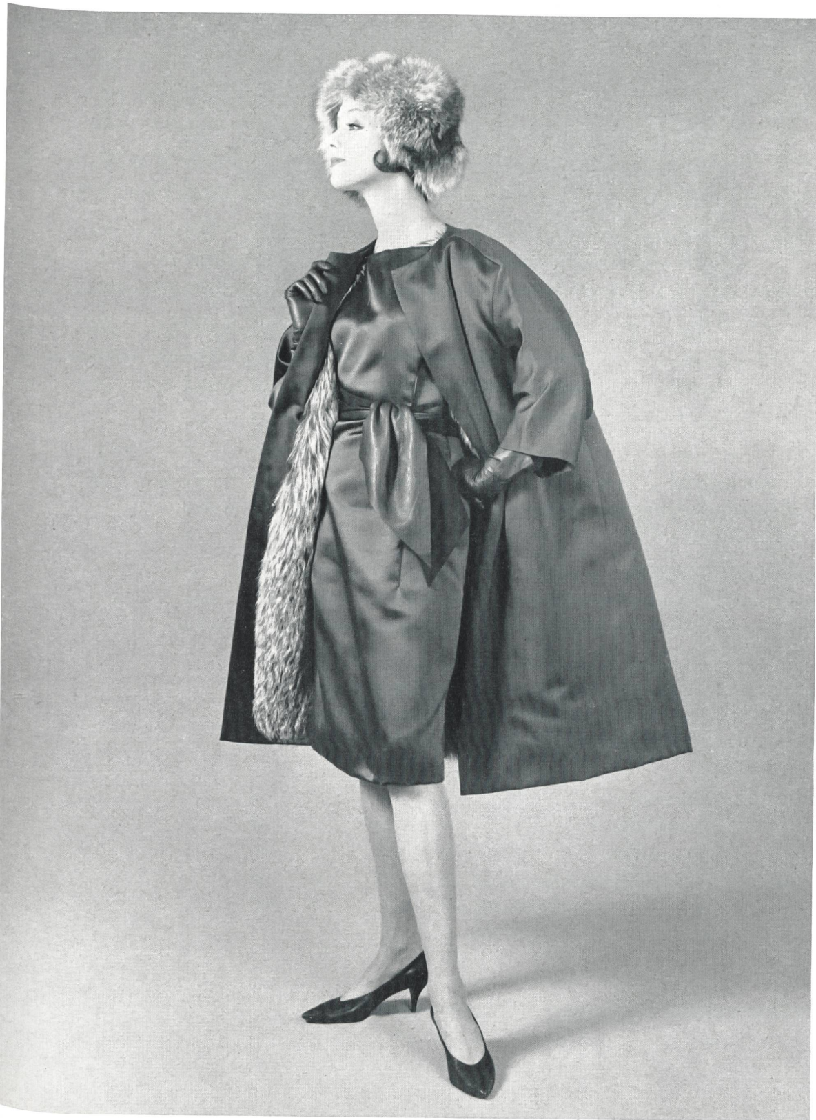
JACQUES HEIM Satin Duchesse de L. Abraham & Cie, Soieries S. A., Zurich