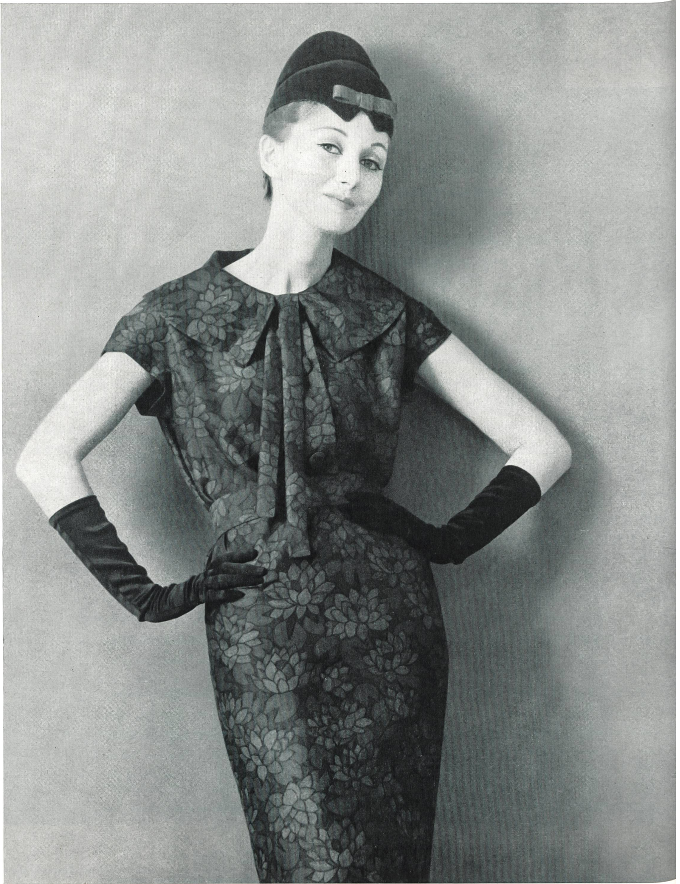
PIERRE CARDIN Soielaine « Miranda » de Reichenbach & Co., Saint-Gall Distribué par Montex, Paris