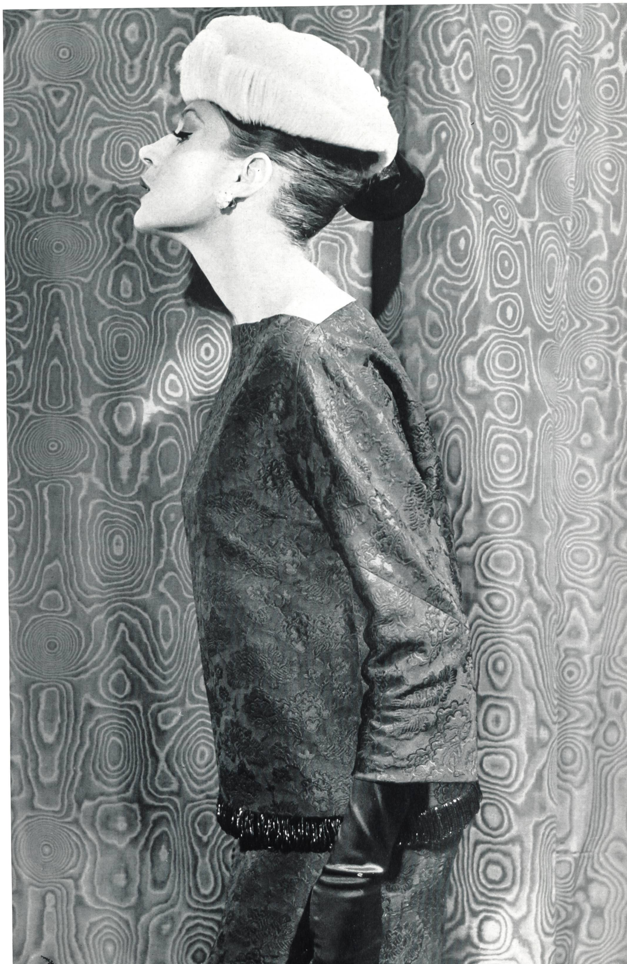
JACQUES GRIFFE Façonné tout soie des Soieries Stehli S. A., Zurich