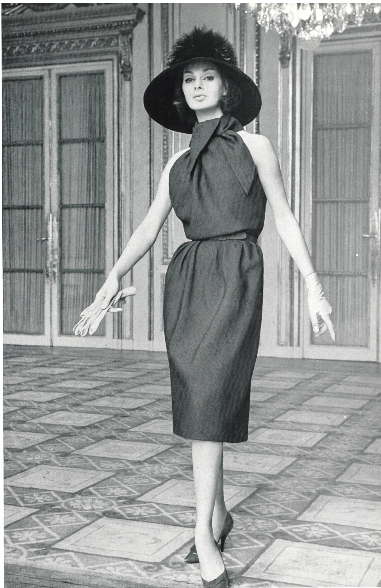
NINA RICCI Tissu « Kolibri », soie naturelle, de Heer & Cie S. A., Thalwil Grossiste à Paris : Robert Burg & Cie