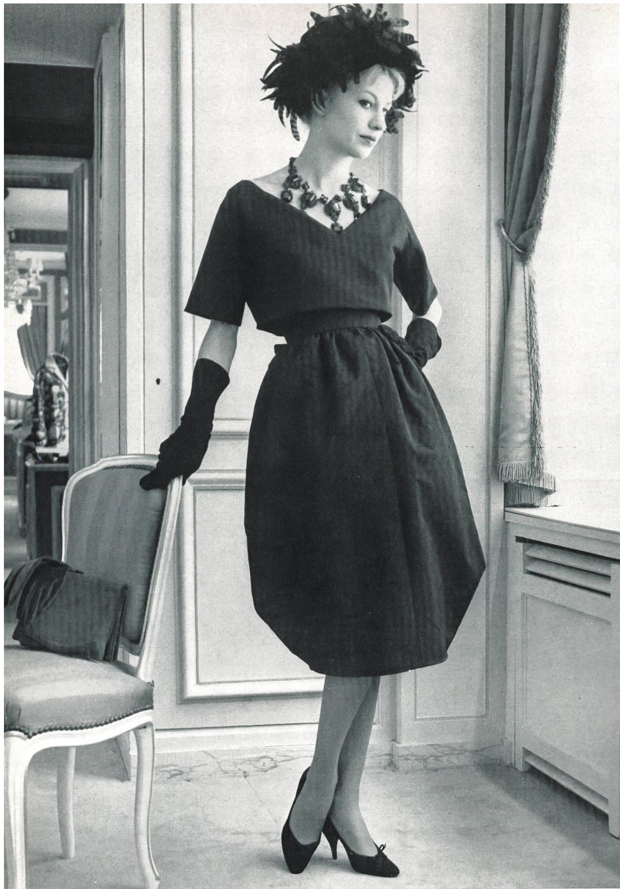
LANVIN CASTILLO Poult de soie noir de la S.A. Stünzi Fils, Horgen