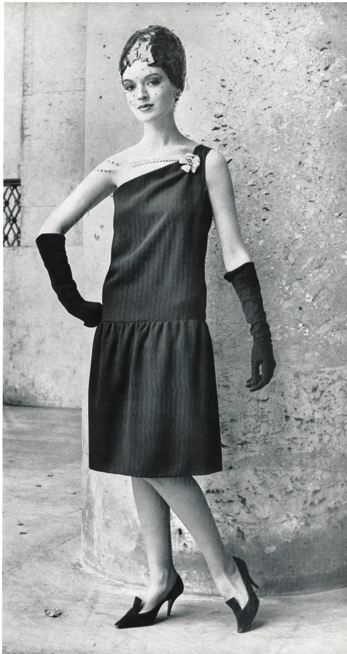
CHRISTIAN DIOR Crêpe noir de la S. A. Stünzi Fils, Horgen