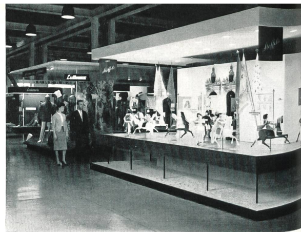
Le stand de Stoffel & Co., Saint-Gall

A part le secteur des stands individuels, dans lequel la présentation est généralement d'un niveau très élevé,