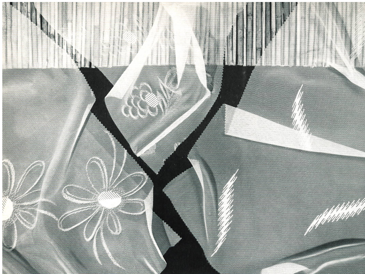
FILTEX S. A., SAINT-GALL

Marquissette fantaisie nouveauté en térylène avec effets de fils coupés Fashionable terylene fancy marquissette with clip-cord effects Marquiseta fantasía de novedad en terylene con efectos de vainica Neuartige Terylene-Fantasie-Marquissette mit Scherli-Effekt