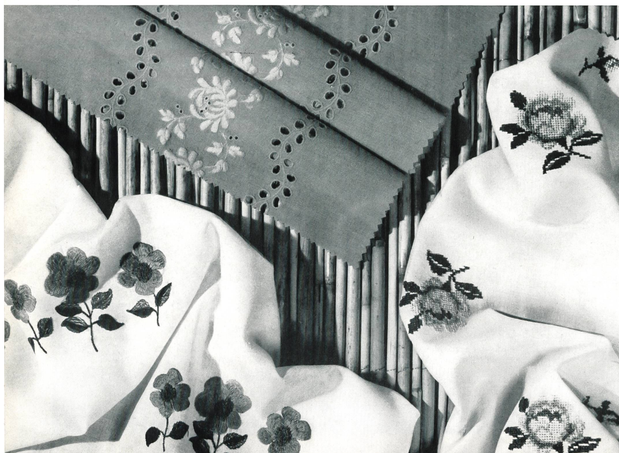
JAKOB SCHLAEPFER SAINT-GALL

Tissu de dralon avec broderie dralon de même teinte. — Tissus dralon avec broderie multicolore en coton Dralon fabric with dralon embroidery in the same shade. — Dralon fabrics with multicoloured cotton embroidery Tejido de dralón bordado con dralón en el mismo color. — Tejidos de dralón con bordados multicolor de algodón Dralongewebe mit Dralonstickerei in derselben Farbe. — Bunte Baumwollstickereien auf Dralongeweben