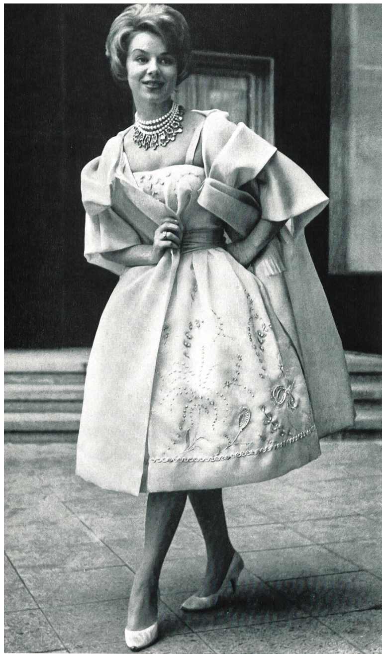
Modèle GACK, ZURICH

Satin organdi pure soie de Pure silk organdy satin by Raso organdi pura seda de Organdy Satin aus reiner Seide von