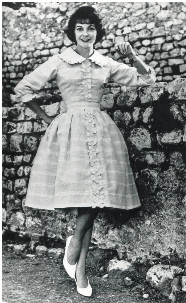
« RECO », REICHENBACH & CO., SAINT-GALL

« Recosablé » Minicare Modèle Brigitte, Cannes