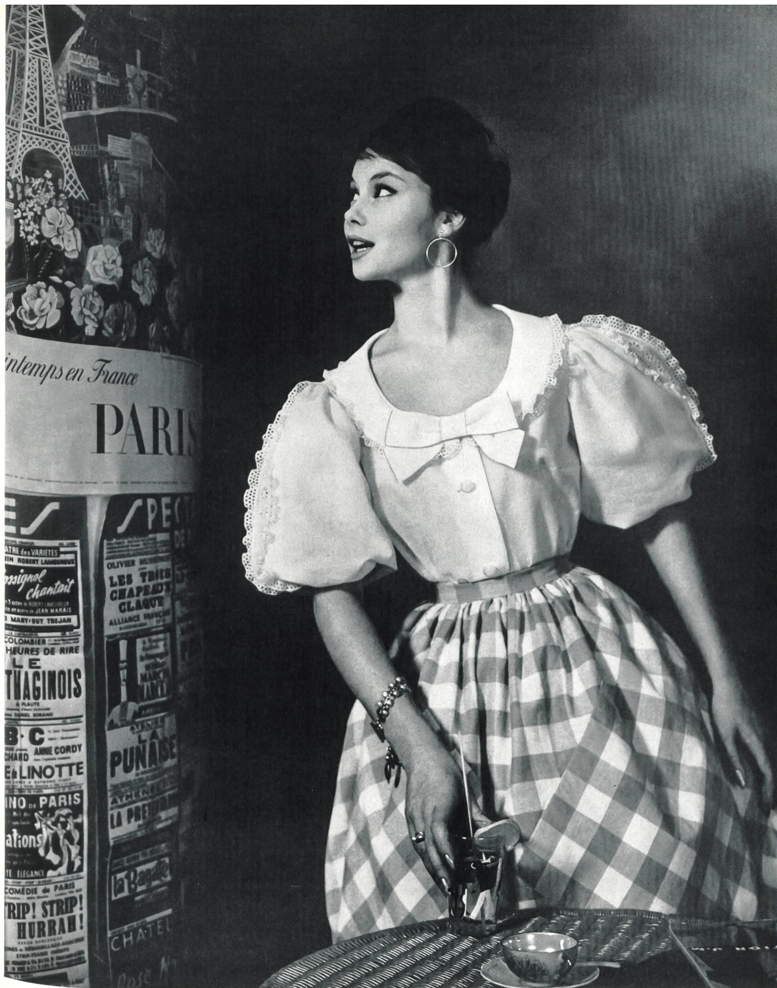
Modèle MODEN S. A., MONTREUX « SAMODE »

Blouse « Nouvelle Vague » en batiste et broderie de Saint-Gall « Nouvelle Vague » blouse in batist and Saint-Gall embroidery Blusa « Nouvelle Vague » en batista y bordado de San-Galo Bluse « Nouvelle Vague » in Batist und Sankt-Galler Stickerei