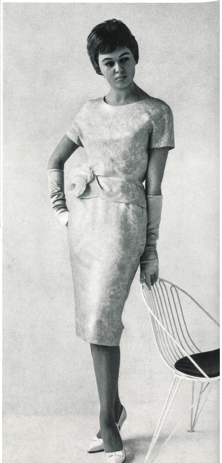
« bégé », BERTHOLD GUGGENHEIM SOHN & CO., ZURICH

Tissu « bégé »-Oki Ama, pure soie « bégé »-Oki Ama silk fabric Modèle A. B. Modelia, Malmö