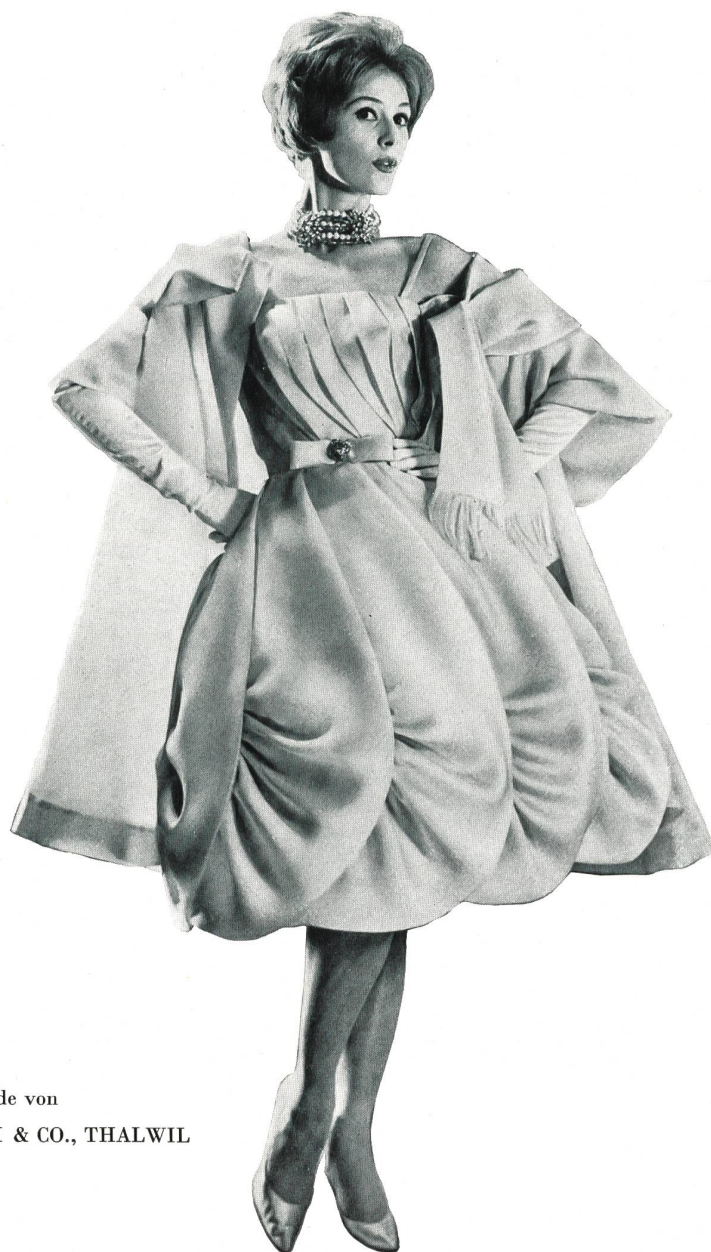
Modèle GACK, ZURICH

Satin organdi pure soie de Pure silk organdy satin by Raso organdi pura seda de Organdy Satin aus reiner Seide von