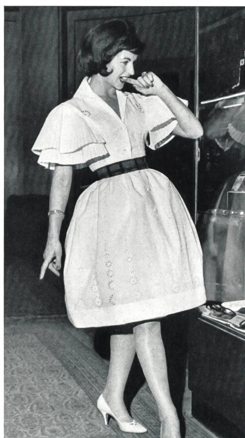
« RECO », REICHENBACH & CO., SAINT-GALL

Batiste brodée Minicare Minicare embroidered batist Modèle Marinelli, Nice