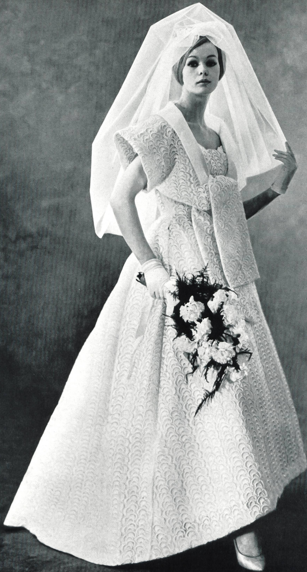
Modèle GACK, ZURICH Photo Rév

Guipure lourde de Heavy guipure by Encaje de guipur pesado de Schwere Guipure-Spitze von FORSTER WILLI & CO., SAINT-GALL