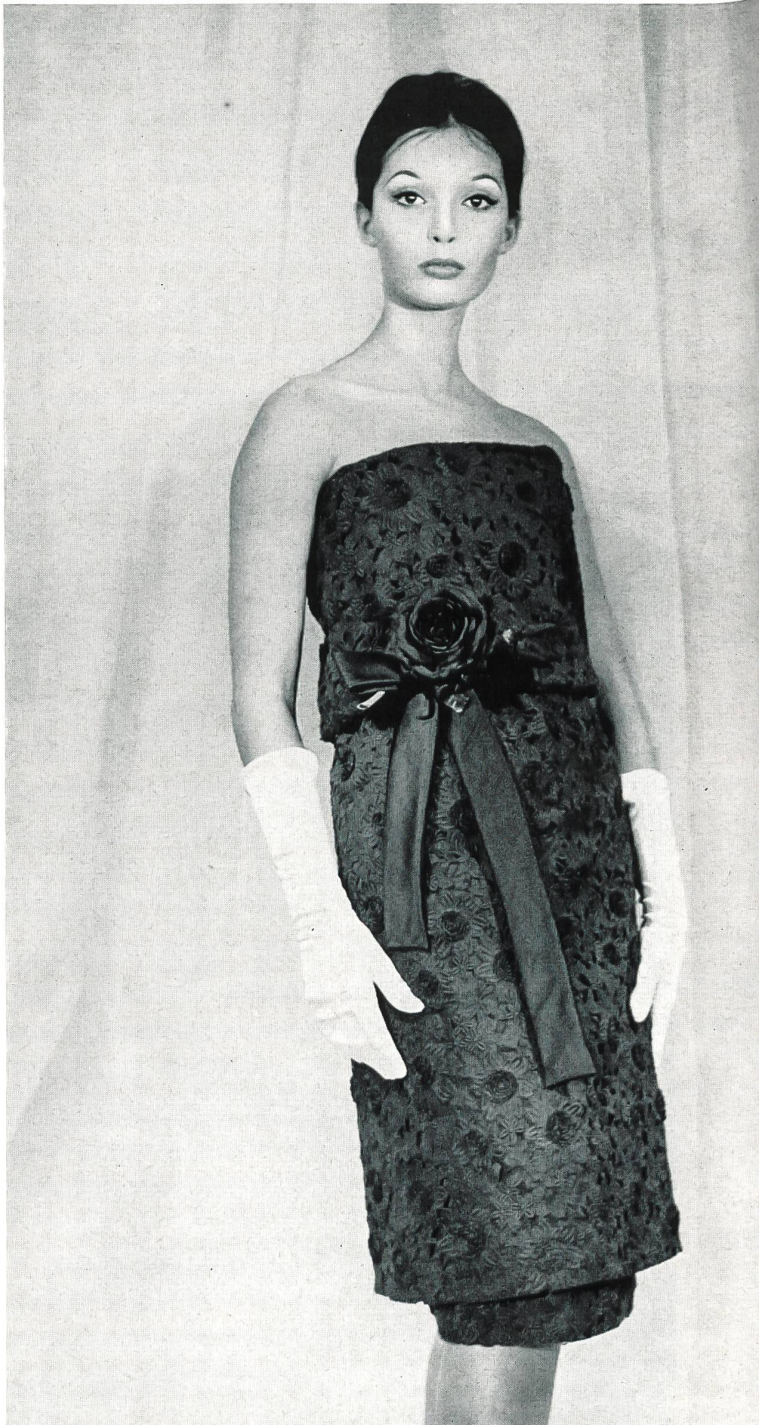
PIERRE CARDIN Organdi brodé nouveauté avec applications de Union S. A., Saint-Gall Grossiste à Paris : Robert Burg & Cie