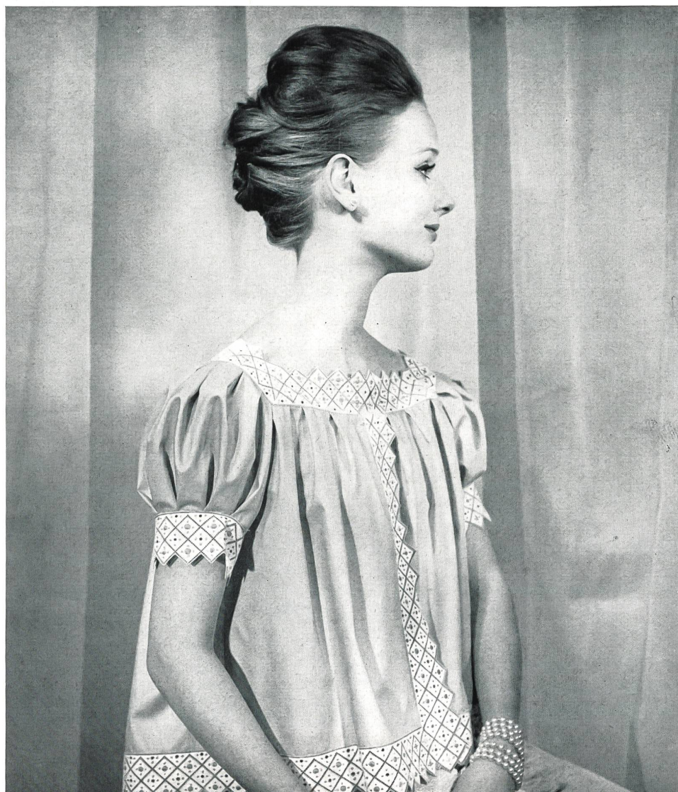
CHRISTIAN DIOR (Boutique)

Bandes brodées en noir sur blanc de A. Naef & Cie, Flawil