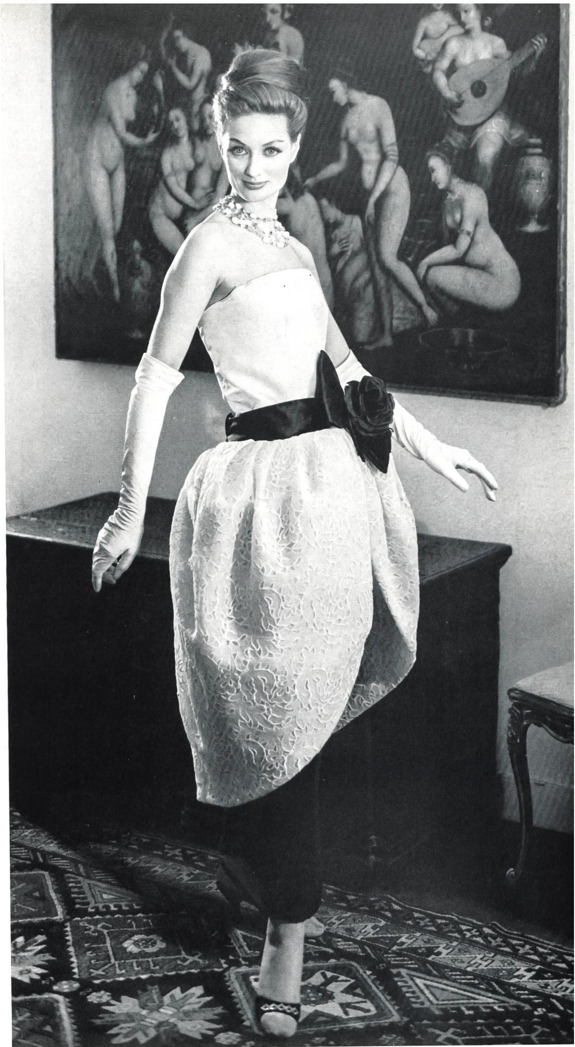
PIERRE CARDIN Organdi blanc brodé et découpé de Théodor Locher & Co., Saint-Gall Grossiste à Paris : Pierre Brivet S.à r.l.