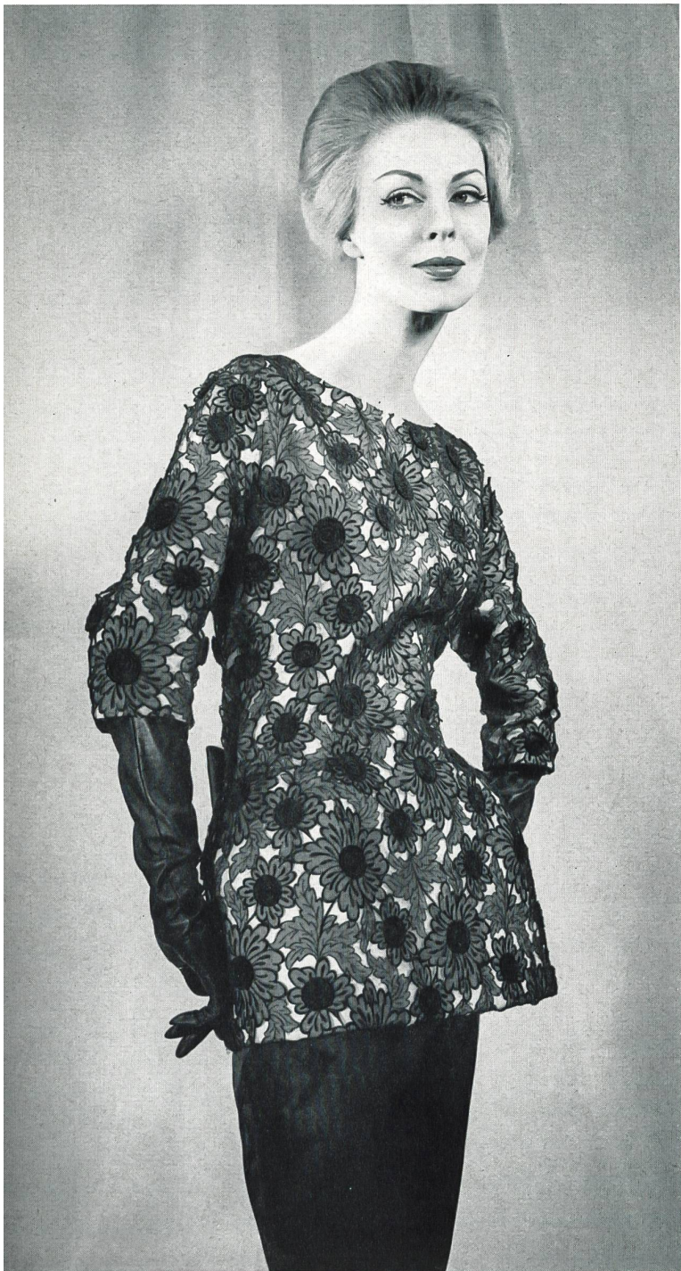
PIERRE CARDIN Organdi brodé nouveauté avec applications de Union S. A., Saint-Gall Grossiste à Paris : Robert Burg & Cie