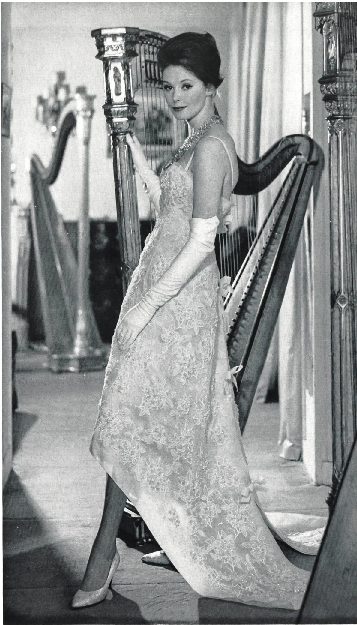
CHRISTIAN DIOR Organdi brodé découpé de Forster Willi & Co., Saint-Gall