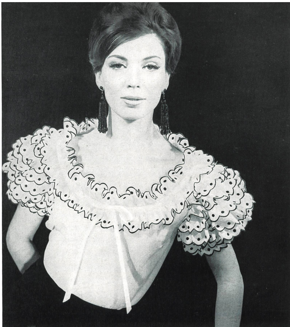
PIERRE BALMAIN (Boutique)

Bandes brodées en noir sur blanc de A. Naef & Cie, Flawil