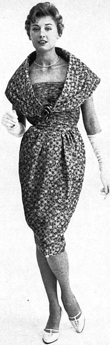
ROBT. SCHWARZENBACH & CO., THALWIL Imprimé pure soie / pure silk printed fabric Modèle Continental Modes, Sydney