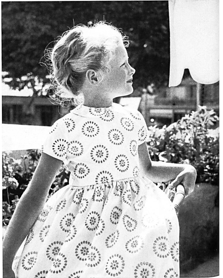
JACOB ROHNER S. A., REBSTEIN

Batiste Minicare blanche, brodée en blanc avec applications d'impression au pistolet. Modèle Michèle Roger