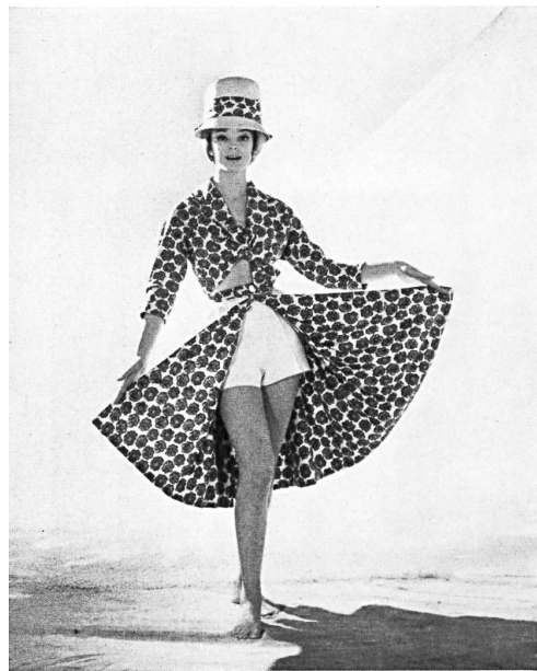
A. BLUM & CO, ZURICH

Trois-pièces en « Tri-co-tiss » d'orlon