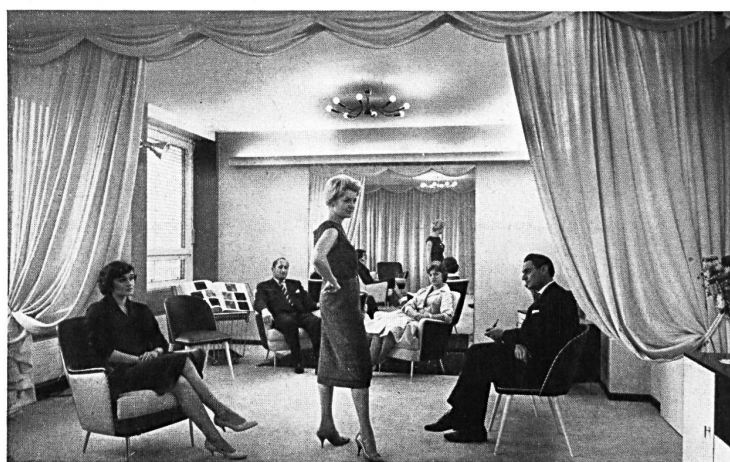
Une présentation dans un salon particulier

Depuis quelques mois, une idée qui était dans l'air depuis longtemps a trouvé sa réalisation, c'est la « Maison suisse de la mode », à Zurich. L'idée, c'était celle d'une collaboration libre dans le domaine de la « promotion » et de la vente, qui avait déjà provoqué la création du groupe « Pro Tricot Suisse » il y a deux ans environ (formule permettant à un certain nombre de fabricants suisses d'unir leurs efforts dans le domaine de la propagande tout en conservant leur liberté en matière de création et de vente). Partie des mêmes milieux, l'idée de la Maison de la Mode allait plus loin : il s'agissait d'offrir à des fabricants de bonneterie et de prêt à porter ne résidant pas à Zurich la possibilité de présenter leurs collections dans cette ville, dans des conditions favorables, sans abdiquer leur personnalité. Avec l'aide du Syndicat des exportateurs suisses de l'industrie de l'habillement, vingt-six producteurs suisses ont uni leurs efforts pour créer le centre permanent de présentation et de vente qu'est la « Maison suisse de la mode ». Dans un immeuble moderne, muni de tous les avantages désirables (parking, garage, restaurant), les acheteurs professionnels de Suisse et de l'étranger pourront voir les collections et faire leur choix en toute tranquillité et en toute discrétion, dans des salons individuels, sans perte de temps, chose avant tout précieuse à notre époque.