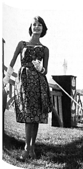
METTLER & CIE S. A., SAINT-GALL

Chaque année, à la fin de l'été, Saint-Gall réunit l'élite du sport équestre à l'occasion de ses « Journées hippiques ». Le cheval est fort en honneur en Suisse orientale, région qui, ne l'oublions pas, était agricole (et elle l'est restée) avant d'être industrielle. Il n'est donc pas rare de trouver sur les palmarès des concours hippiques, des noms connus dans le monde des textiles.