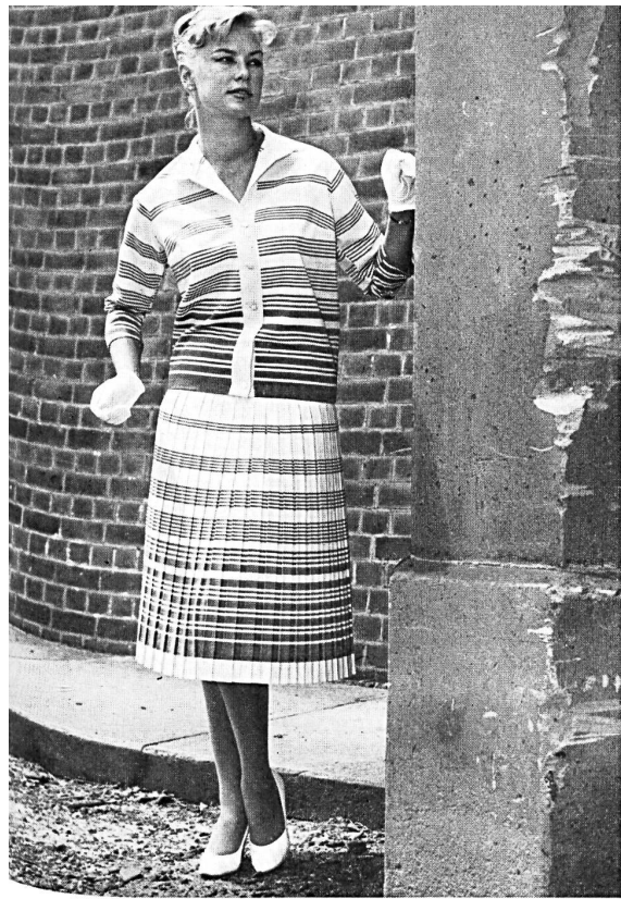
HEER & CO., S.A., THALWIL

Fabric/tissu : Terylène-Bordure Modèle Sports de Jour Mfg. Co., Marrickville-Sydney