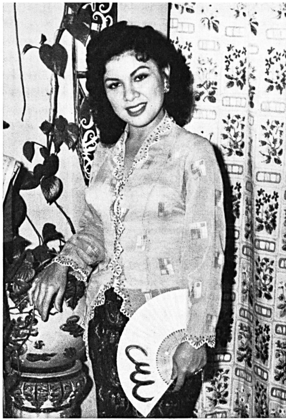
« GEBA », ABEGG BROTHERS, HORGEN

Fabric/tissu : Terylène-Bordure Modèle Sports de Jour Mfg. Co., Marrickville-Sydney