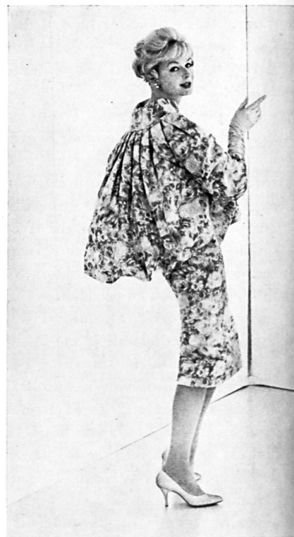
L. ABRAHAM & CO. SILKS LTD., ZURICH

La maison Werlé s'est spécialisée, dès ses débuts, dans l'usage de tissus fins importés, qui donnent aux créations une saveur unique, combinée au « je ne sais quoi » particulier à la Californie. Le succès qui en est résulté a encouragé Werlé dans cette ligne de conduite et a provoqué une augmentation de ses achats à l'étranger, dont une grande partie provient de Suisse. Ses plus importants fournisseurs sont Forster Willi, Abraham et