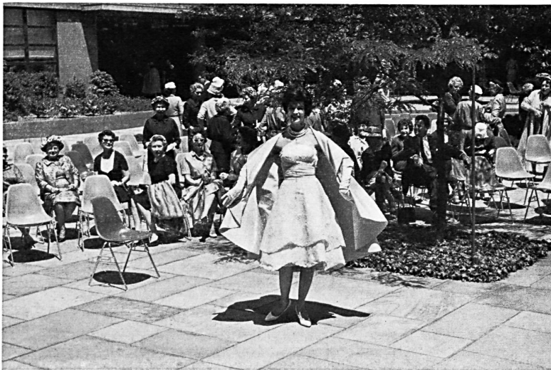
Embroidered organdie Organdi brodé Modèle Pauline Trigère, New York