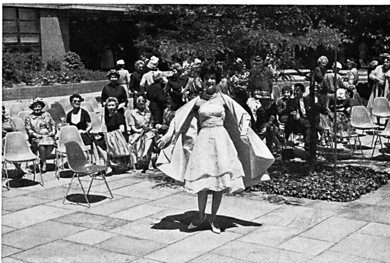
Embroidered organdie Organdi brodé Modèle Pauline Trigère, New York