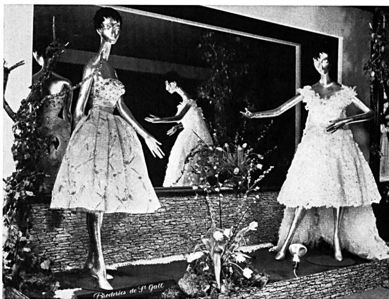
L'exposition de broderies au foyer du théâtre