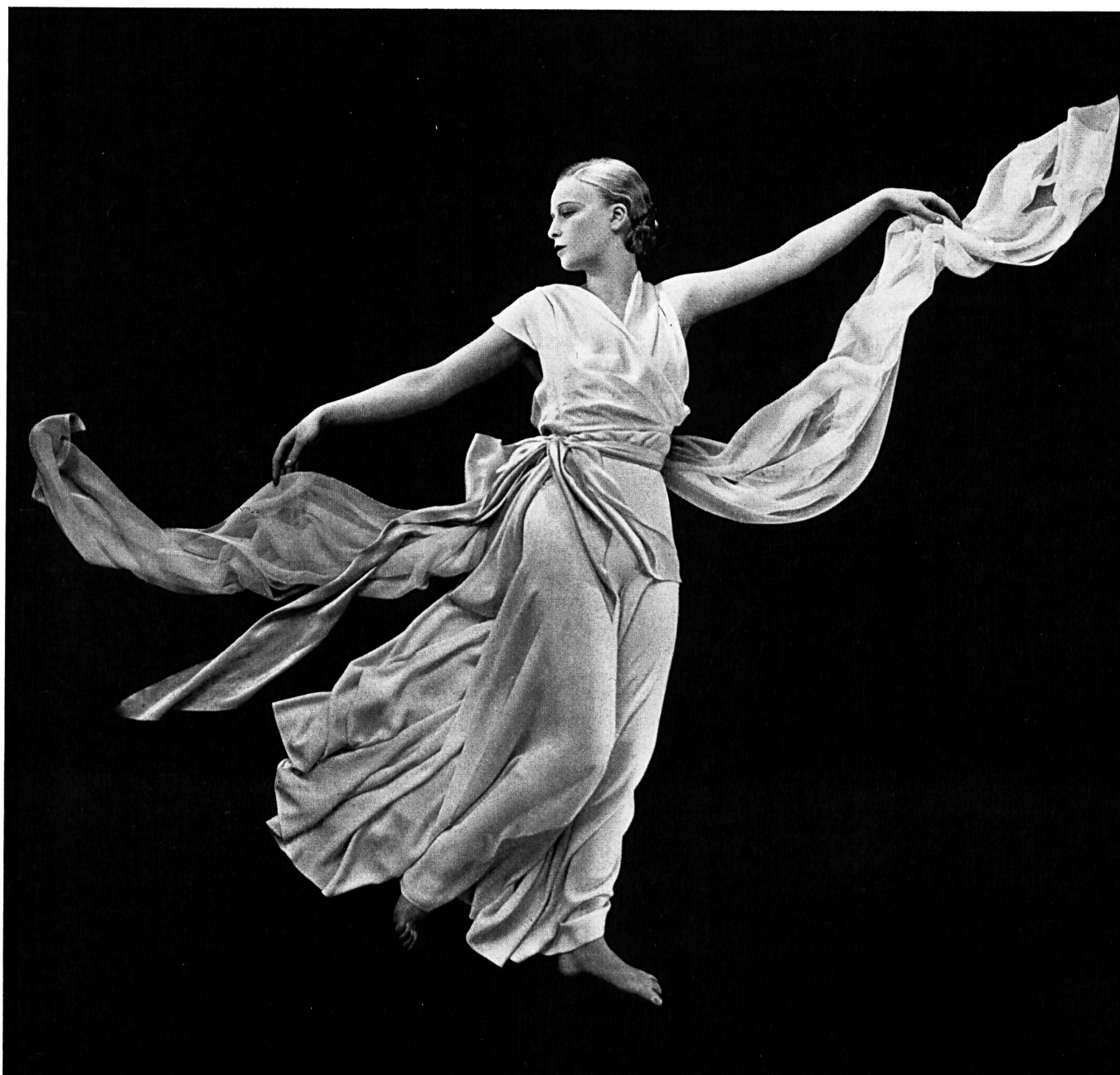
Drapage de Madeleine Vionnet