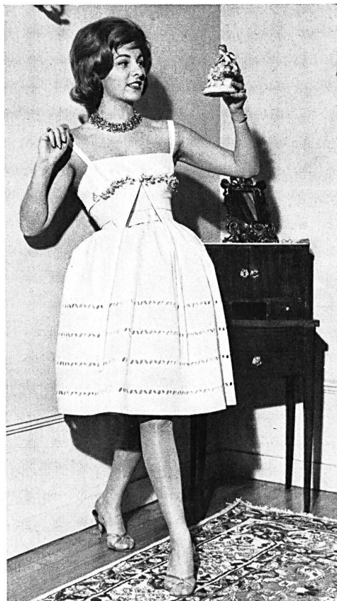
« RECO », REICHENBACH & CO., SAINT-GALL

Batiste « Minicare » brodée. Embroidered « Minicare » cambric. Modèle Jane Lend, Paris.