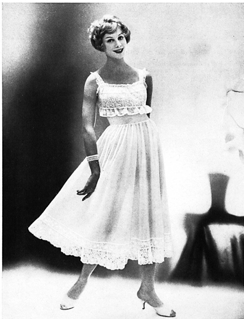
BISCHOFF TEXTILES LTD., SAINT GALL

Embroideries on nylon. Broderies sur nylon. Model by Kickernick, Inc., Minneapolis.