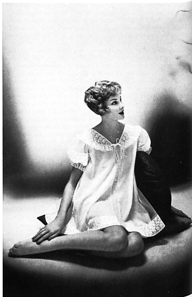
BISCHOFF TEXTILES LTD., SAINT-GALL

Embroideries on nylon. Broderies sur nylon. Model by Kickernick, Inc., Minneapolis.