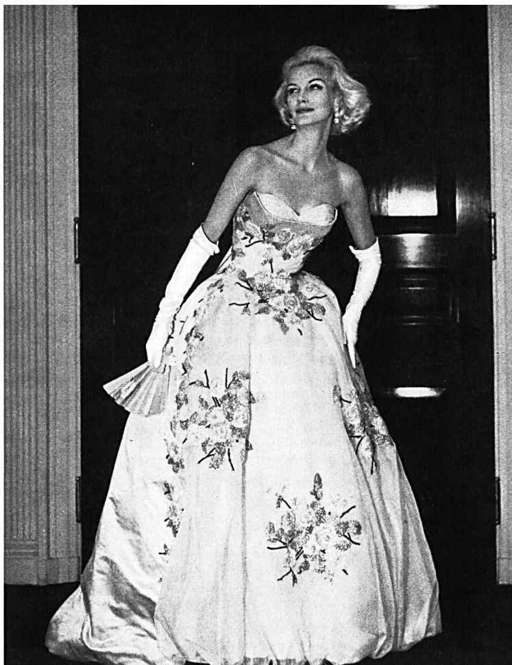
FOSTER WILLI & CO., SAINT-GALL

Si les tissus de coton fin, les broderies, les nouveautés en lainages, les tissus mixtes, les tricots importés de Suisse ont acquis une si bonne renommée dans la confection américaine, ils le doivent en bonne partie à l'incessant progrès de leurs finissages et de leurs teintures. Wash-and-Wear, Drip-and-Dry, No-Iron sont des caractéristiques bien modernes des articles suisses, même des fragiles broderies et des tissus de cotons fins issus de l'ère victorienne et qui