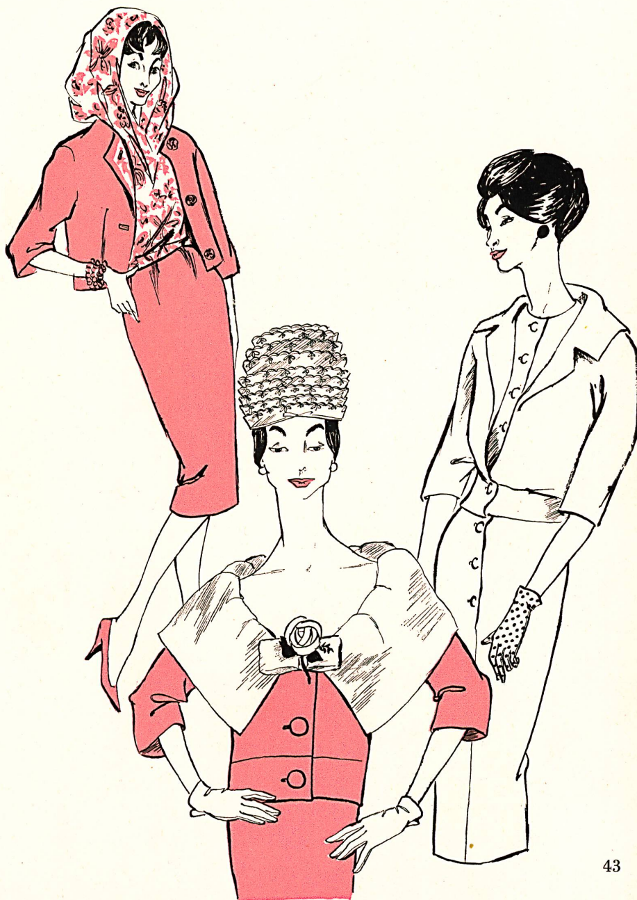
Gauche : GUY LAROCHE Centre : PIERRE CARDIN Droite : JACQUES HEIM

Me voilà très embarrassé, car je m'aperçois qu'au fond je ne vous ai rien dit qui donne une idée technique des dernières collections. C'est que, peut-être, en cette saison, la technique se cache. Elle est là, elle est la structure, la toile de fond sur laquelle on a brodé les éblouissantes arabesques.