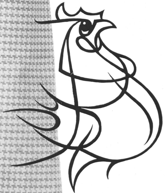
Modell Nr. 425

Während der Export-Woche vom 27.-31. Mai zeigen wir unsere Kollektion in Zurich im Glockenhof, Sihlstrasse 31 Telefon (051) 23 56 60 Bischoff Textil AG St. Gallen