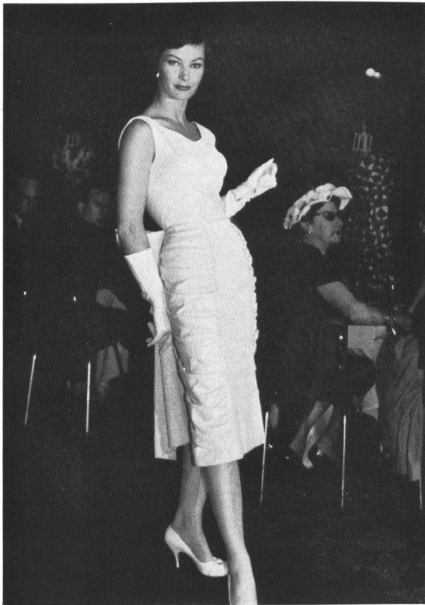
Luxor lamé, façonné ; infroissable. Luxor, crease resisting figured lamé. (Staple fibre - cotton - Lurex.)