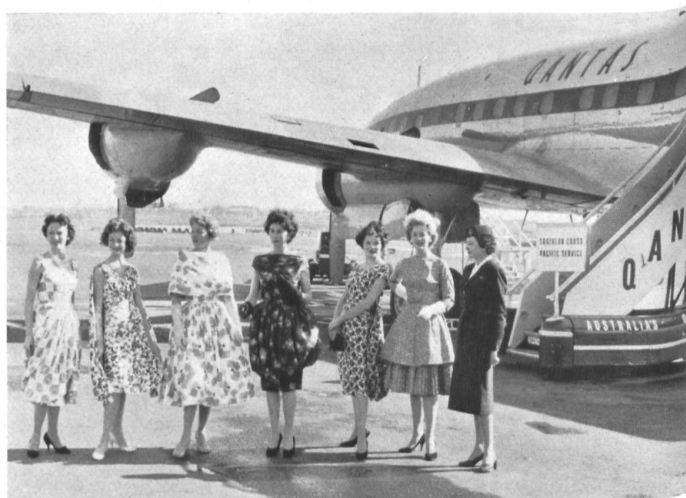
Arrivée des mannequins à Sydney. Arrival of the mannequins in Sydney.

SEIDENWEBEREIEN GEBRÜDER NAEF A.-G., in ZÜRICH