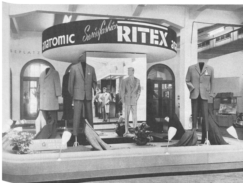
Le stand « Ritex », Roth, Iseli & Cie, Zofingue

facture, coupe soignée et goût. Par ce dernier terme, nous voulons exprimer la recherche vestimentaire qui, sans se tenir à l'écart des idées modernes et même parfois audacieuses, ne perd néanmoins jamais de vue les nécessités pratiques : vêtir avec élégance et correction.