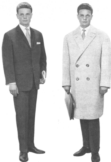
Modèles PKZ