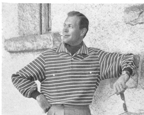
Modèles « Lutteurs », AG. Fehlmann Söhne, Schöffland

facture, coupe soignée et goût. Par ce dernier terme, nous voulons exprimer la recherche vestimentaire qui, sans se tenir à l'écart des idées modernes et même parfois audacieuses, ne perd néanmoins jamais de vue les nécessités pratiques : vêtir avec élégance et correction.