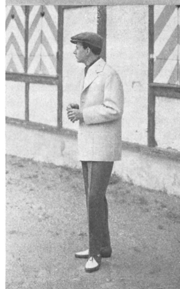
Modèles Ritex