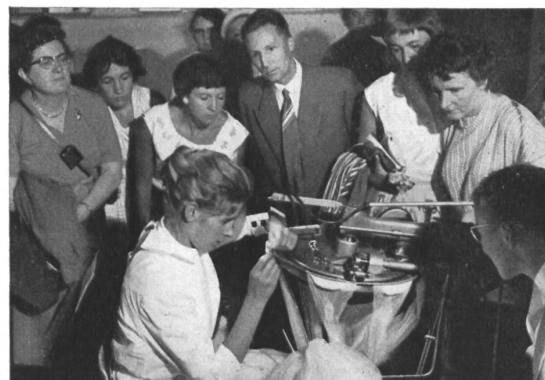
Société de la Viscose suisse, Emmenbrücke

A la SAFFA, la Société de la Viscose suisse fut représentée tout d'abord par un stand de renseignements sur le nylon « Nylsuisse » (marque déposée) dans la pavillon de l'Institut de Recherches Ménagères de Zurich. Elle fut également présente dans la halle consacrée à « La femme dans l'industrie », dans le groupe « Industrie textile », placé sous le patronage de l'Association patronale de l'industrie textile. A part les nombreux tissus de fibres artificielles et synthétiques exposés dans la « Tour de la Soie » (voir page 150, fig. 3); elle eut là un stand renseignant le visiteur sur la fabrication et l'usage de tous les produits de la maison : fils de nylon, de rayonne et de fibranne, paille artificielle pour le tressage, cheveux artificiels pour perruques, etc.