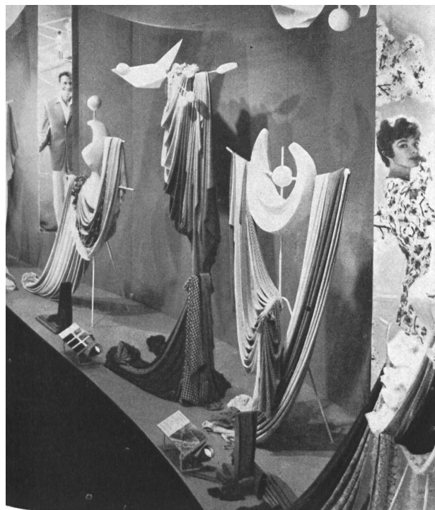
L'industrie lainière suisse était représentée en plusieurs sections de la SAFFA, en particulier par une exposition thématique de l'habillement. Nous voyons ici une vue du stand de l'exposition organisée au Carrousel de la Mode par l'Association suisse de l'industrie lainière et groupant les produits de 36 fabricants.