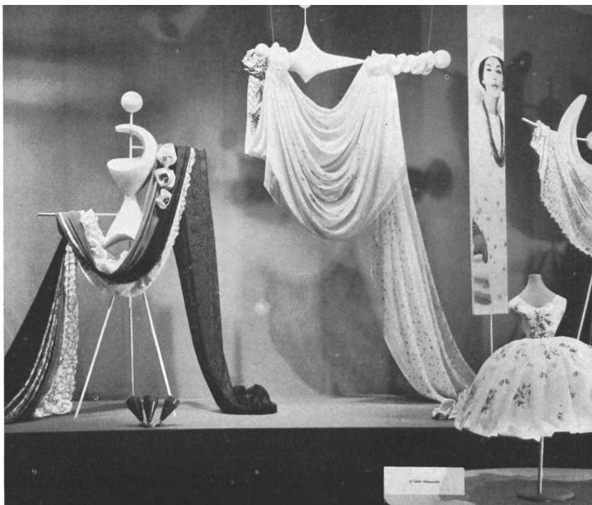
Exposition des broderies de Saint-Gall dans le Carrousel de la Mode . Arrangement : M me Tildy Grob-Wenger